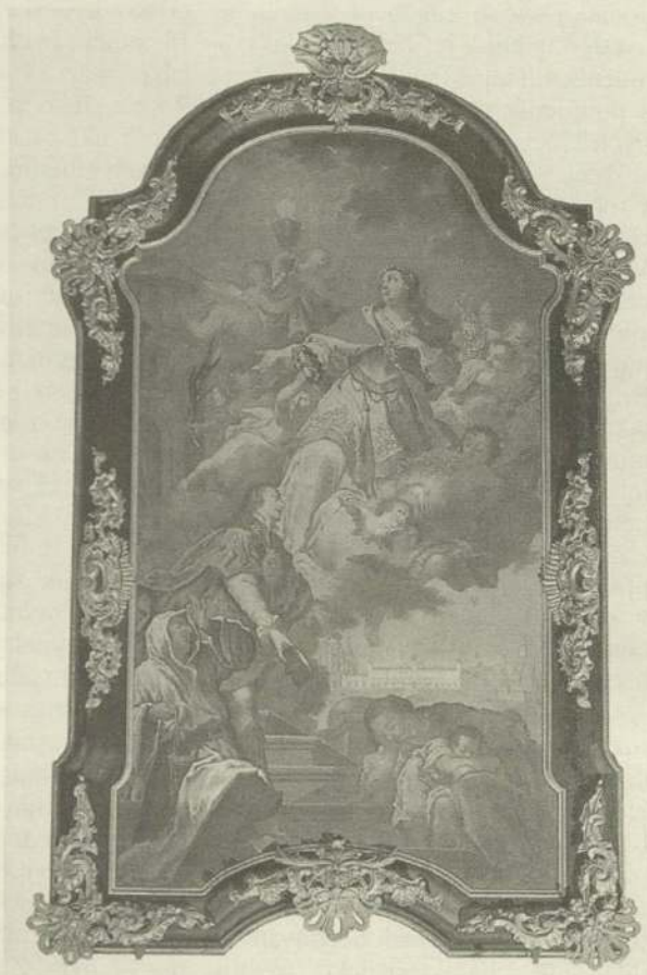
Apotheosa sv. Barbory

legitimní a prospěšná přítomnost ve městě je na obraze rovněž oslavena. Na vedutě města v pozadí obrazu je proto mimo oba hlavní městské kostely zdůrazněna i sluncem zalitá kutnohorská jezuitská kolej. Obraz dobře ilustruje charakteristické rysy tvorby Ignáce Raaba, malíře, který byl již za svého života obdivován pro neuvěřitelnou lehkost tvoření a zcela mimořádnou plodnost a který zásadně přispěl k vývoji české barokní malby v její závěrečné fázi.