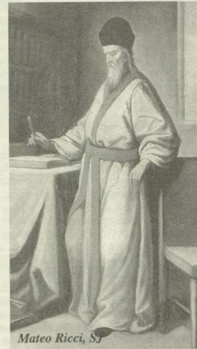
Mateo Ricci, SJ