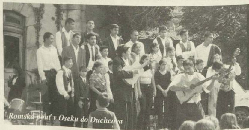
Romská pouť v Oseku do Duchcova

* 25. 9. bude mít P. Ambros v Praze přednášku na téma Rusko a nově se tvořící Evropa.