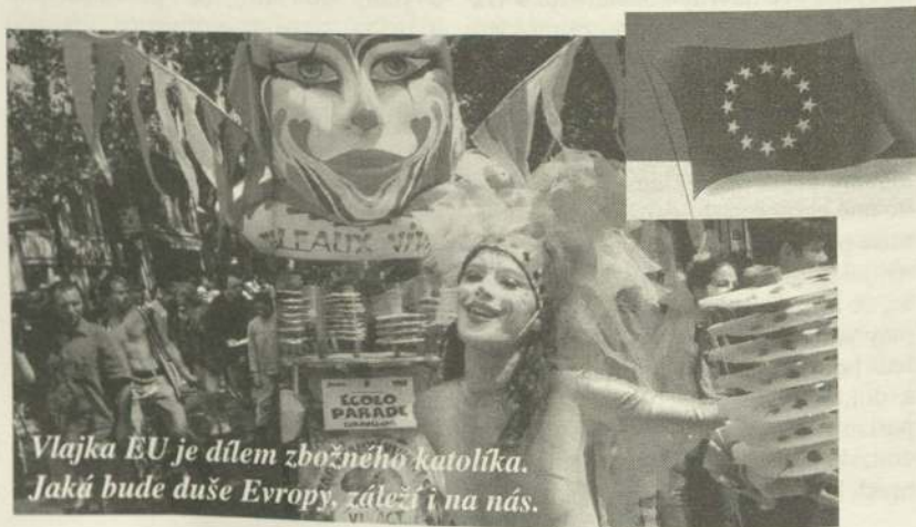
Vlajka EU je dílem zbožného katolíka. Jaká bude duše Evropy, záleží i na nás.

Vlajka s dvanácti hvězdami je dílem zbožného katolíka. Jaká však bude duše Evropy, záleží také na nás.