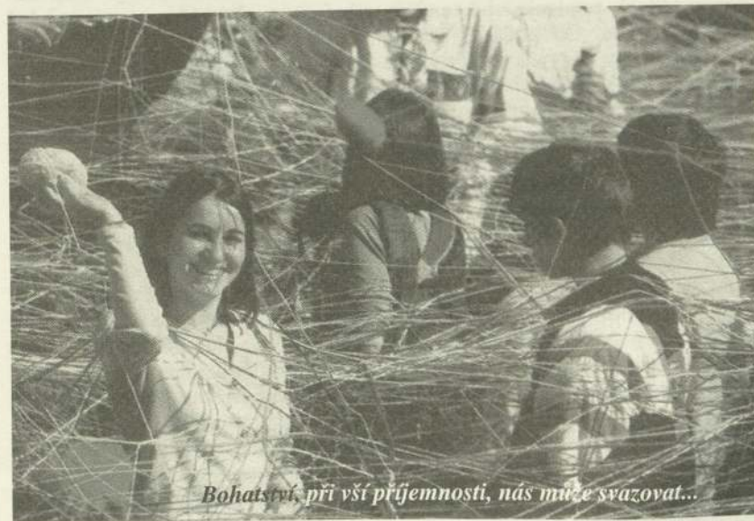
Bohatství, při vší příjemnosti, nás může svazovat...