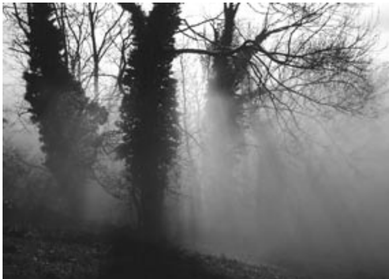
Ilustrační foto (Petr Vacík)