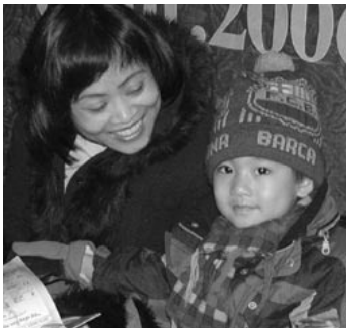
Recepce v pražské rezidenci 1. ledna

pomáhá budovat Církev. Díky patří také Církvi v České republice, která doposud v různých diecézích s velkou otevřeností a ochotou pomoci vycházela vstříc našim požadavkům a starostem. Biskupové a faráři rozumějí: také Vietnamci jsou součástí jediného Božího lidu, který se z mnoha jazyků a kultur schází v jejich konkrétní místní Církvi.