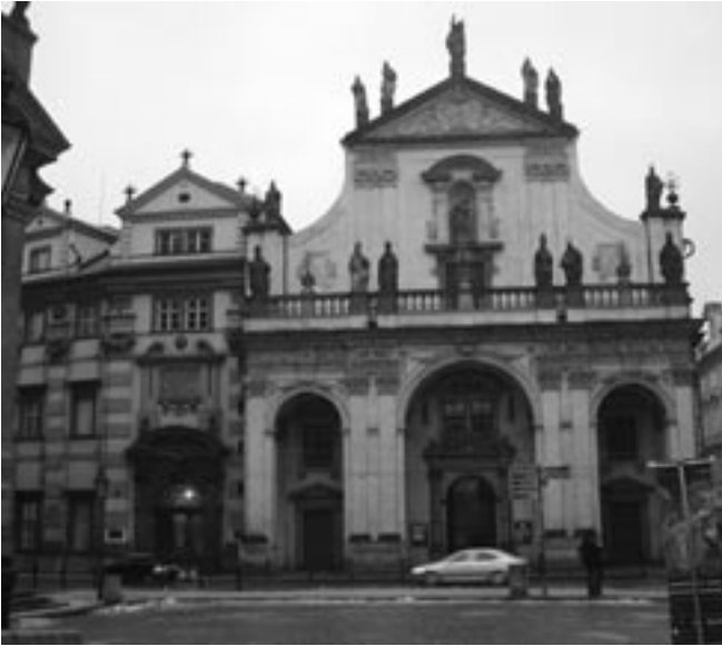
Koleji vévodí kostel Nejsvětějšího Salvátora

cibiskupa Miloslava kardinála Vlka. Sejde se na ní více než sto odborníků od nás i ze zahraničí. Konference bude probíhat paralelně, tedy současně v několika sekcích, týkajících se aktivit klementinských jezuitů. Vedle vědy sem patří například divadlo, hudba, výtvarné umění, architektura a v neposlední řadě jezuitská spiritualita. Přednášky však budou přístupné i laické veřejnosti a budou doplněny zajímavou výstavou k tématu Jezuité a Klementinum v prostorách Národní knihovny.