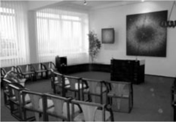
Kaple Nejsvětějšího Srdce Ježíšova

Brtníkové vystupoval s velkým úspěchem např. při návštěvě Svatého otce v Hradci Králové v roce 1995.