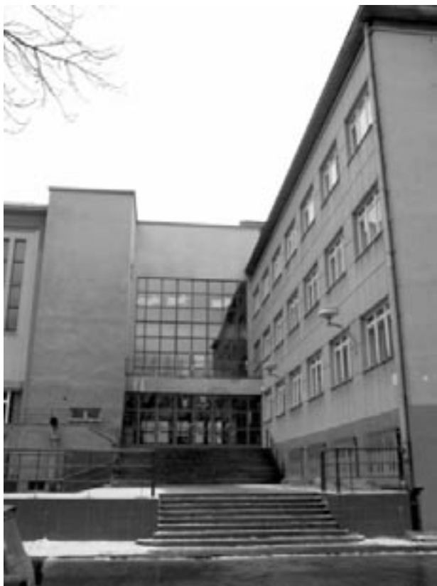
Vchod do školy

na, tenisový kurt, stravovací zařízení, technické vybavení jednotlivých předmětů a mnoho dalšího). Velký důraz se kladl na výuku cizích jazyků. Podařilo se k tomu získat i několik velmi dobrých lektorů, některé dokonce ze zahraničí. V pozdější době se uskutečňovaly i výměnné návštěvy ze zahraničí, studium některých studentů v Americe atd. Pořádaly se různé akce, divadelní představení – dramatický kroužek paní prof.