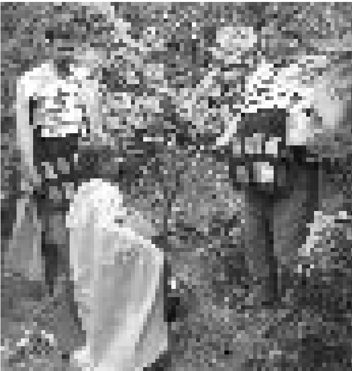
Pasování na rytíře