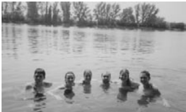
Relaxace v jezeře v Ludwigshafenu

byli zde jen uprchlíci z oblastí postižených válkou, ale také například Italové z chudého jihu. Dále jsme v Mannheimu navštívili největší mešitu v Německu a mohli se zúčastnit večerní modlitby, která na nás udělala velký dojem. Zvláště zajímavá byla očista před obřadem. U přílehlé kašny si člověk musel umýt ruce, nos, krk, tvář, uši, vlasy, zátylek, nohy a opět ruce. Poté následovalo pohoštění a debata o našich rozdílných kulturách. Experiment zakončilo dětské odpoledne, které jsme společně připravili.