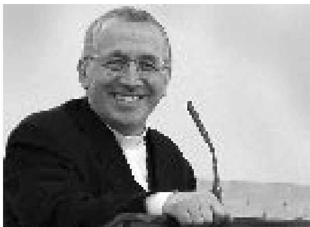
Na přednášce ve studentském pastoračním centru v Bratislavě

Jazyk se mění a je třeba užívat takového jazyka, který je čitelný a jasný. Proto předávání víry vyžaduje na prvním místě bezprostřední zakořenění v každodennosti lidí. Je třeba se dotknout jejich problémů. Ze své zkušenosti mohou říci, že duchovní vedení, ve kterém se dotkneme lidské duše, bývá dokonalou přípravou k předávání víry. Díky duchovnímu doprovázení se učí-