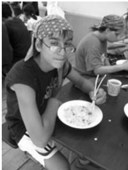
Děti si vyzkoušely náročnost inkulturace, když musely jíst rizoto paličkami.

Následující den je však už čekala dobrodružná plavba do Indie se sva-