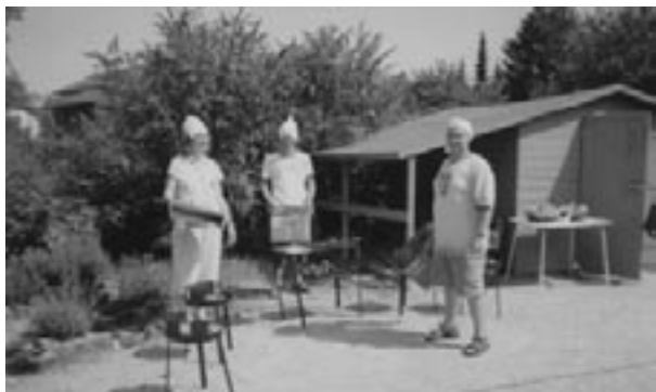
Grilování na dětském odpoledni v Ludwigshafenu

Město Ludwigshafen přímo sousedí s Mannheimem, a tak jsme se mohli mezi městy snadno přesouvat. Zde jsme projekt zaměřený na poznání migrantů prožívali společně s Litevci a Maďary (a s několika zástupci z dalších zemí). Navštívili jsme centrum, ve kterém sídlila též mateřská škola. Tady jsme poznali děti takřka z celého světa a musíme konstatovat, že bylo nádherné vidět, jak si zde všechny společně hrají, bez rozdílu ras a náboženství. Poté jsme s některými rodiči diskutovali a dozvěděli se něco o jejich osudech. Ne-