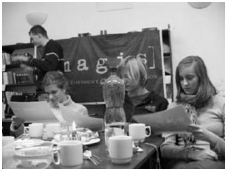
Ze setkání ve studentském klubu