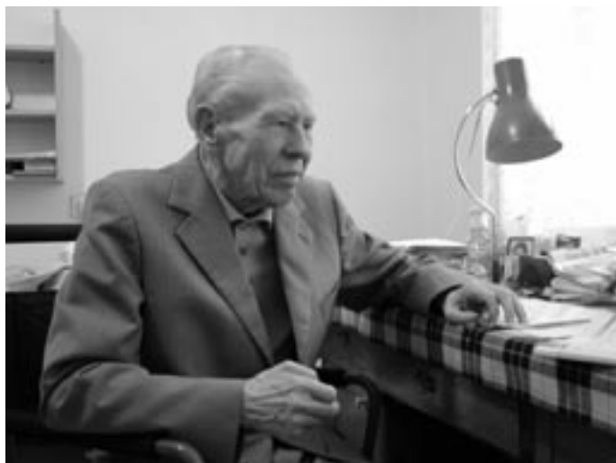
Ani opakované věznění ho nezlomilo.

a uvězněn v Praze na Pankráci a pak v koncentračním táboře v Terezíně. „Soud proběhl ve Strakově akademii a tři z nás jsme byli osvobozeni pro nedostatek důkazů. Byli jsme proto vráceni do koncentračního tábora. Takže paradox byl v tom, že ti, co byli odsouzeni, na tom byli lépe, protože se ocitli ve věznicích nebo káznících, kde aspoň byl určitý řád, kdežto v Terezíně vládla úplná zvůle dozorců,“ vysvětluje Otec Rudolf. „Později jsem se dozvěděl, že jsme v soudních spisech měli zápis RU (Rückkehr unerwünscht – návrat nežádoucí). Takže jsme byli určeni k likvidaci.“