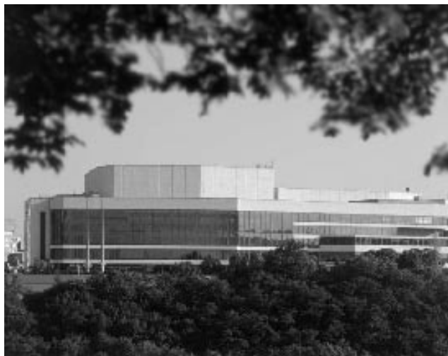
Budova Kongresového centra v Praze

vená tělesa nemohla být za planety považována, a pro tyto nové objekty byl zaveden název „trpasličí plane- ta“ (tento překlad anglického výrazu „dwarf planet“ mi nepřipadá zrovna češtinářsky zdařilý, ale slovo „pla- netka“ již je zadáno – je to ekvivalent anglického „minor planet“). Nejjed- nodušší myslitelnou definicí planety v rámci Sluneční soustavy by byl prostý výčet všech planet. IAU však chtěla vytvořit definici, která by se event. dala rozšířit i mimo Sluneční soustavu, a tak potřebovala definici na základě astrofyzikálních vlastnos- tí daných těles. Všem bylo jasné, že každá fyzikálně podložená definice planety, která chce vyloučit Xenu, UB313 ad., nutně vyloučí i Pluto, které napříště již nebude planeta, ale „trpasličí planeta“ spolu s Xenou, UB313 apod.