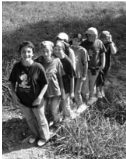
Účastníci tábora s jezuitskou tematikou v Bratřejově.

tým Františkem Xaverským a misionářské úsilí v Asii. Zatímco je sv. František opustil před branami Číny, děti se pustily společně s dalšími zapálenými jezuitami do christianizace země za Velkou čínskou zdí. Aby bylo jejich úsilí úspěšné, zřekli se mladí misionáři svého způsobu stolování, a tak se na oběd jedlo rizoto dřevěnými paličkami. Večer posedávali na poduškách při rozsvícených svíčkách a čadících tyčinkách a pili voňavé čaje. Zakreslili čínskému císaři mapu jeho země a snažili se vzdělávat ve hvězdářství, aby si získali respekt čínských učenců. Zrušení Tovaryšstva Ježíšova papežem Klementem XIV. přežili v ruském exilu, kde řád díky carevně Kateřině dál půso-