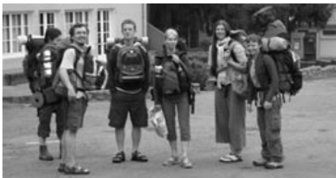
Výprava do Lurd

rozdělení do menších mezinárodních skupinek. Velké ruksaky nám vždy přivezli na následující stanoviště a my jsme, předzásobeni vodou a jídlem, v patách s organizací Červeného kříže, putovali přes hory a roviny. V dalším už stanovém táboře kultura hygieny prudce klesla: museli jsme se spokojit se zahradní hadicí a jámami, ale pohled na okolní hory byl tak kouzelný, že nám nic nemohlo sebrat hluboký zážitek z krásy přírody. Každý den pokračovalo sdílení a bohoslužby v malých, ale překrásných baskických kostelech.