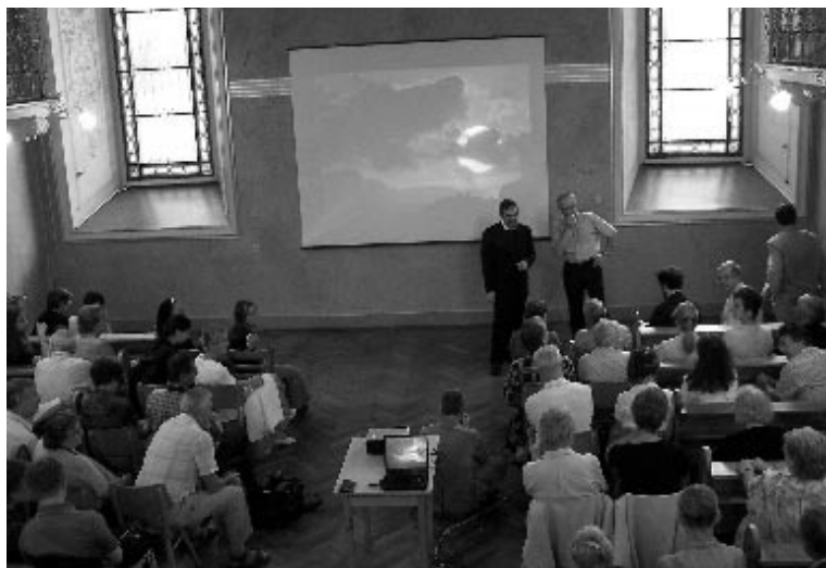
Beseda s vatikánským astronomem zaplnila obnovenou Družinskou kapli

formulaci této definice, jakož i o tom, jak fandům Pluta tuto hořkou pilulku osladit. Je smutné, že v médiích se referovalo o zmatku kolem znění rezolucí, aniž by se udal jeho skutečný důvod. Zároveň dostali hodně prostoru stoupenci Pluta a různé nekonstruktivní kritické hlasy, takže se zdá, že důvodem onoho zmatku kolem definice byla otázka Pluta. Tak nabyli mnozí dojmu, že se celé dva týdny jednalo o tom, zda Pluto je planeta, či nikoliv. Široká veřejnost proto byla jen utvrzena v přesvědčení, že astronomové – a vědci všeobecně – jsou potrhlí a podivnější paraziti, kteří jen plýtvají penězi daňových poplatníků, neboli lidí, kteří – na rozdíl od vědců – dělají „opravdu užitečné“ věci.