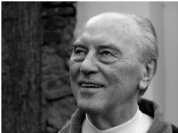
Bývalý japonský misionář na výpomoci v České provincii

Věřím, že o naše absolventy budou mít zájem i firmy, které budou hledat prostě poctivé a spolehlivé zaměstnance. A naši studenti jsou křesťansky zakotvení lidé, kteří vyznávají zásady, se kterými lze počítat.