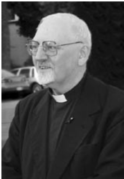
Generální představený Peter-Hans Kolvenbach

vřeně generál Kolvenbach. A dodává, že Ignác z Loyoly sice kdysi rozhodl, že úřad generálního představeného bude na doživotí, a nedá se popřít, že to má i jisté výhody. Od 16. století, kdy bylo toto rozhodnutí učiněno, se však délka života nápadně prodloužila, namítá generál. „Ignác zemřel, když mu bylo 65 let, a to už bylo v jeho době poměrně hodně, a byl generálním představeným 15 let. Jeho dva bezprostřední nástupci se dožili 53 a 62 let, a jejich generalát v obou případech trval sedm let. Když se s nimi srovnám, jsem generálním představeným už déle než 22 let,