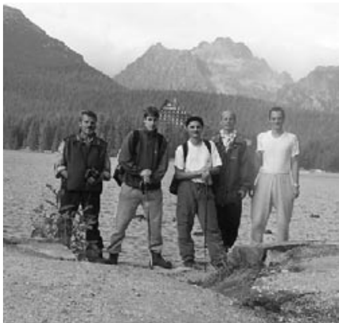
Novicové pravidelně vyrážejí do hor

novicové do nového působiště nastěhovali na podzim r. 1992. Noviciátní dům byl zasvěcen ctihodnému Martinu Středovi, který sám byl během 17. století novicmistrem České provincie.