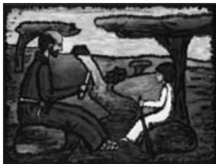
„Chtěl jsem sloužit Ježíši chudému a pokornému“