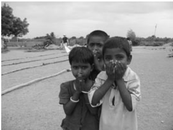
Děti z Manvi

Jezuité na Slovensku už podpořili podobný projekt ve spolupráci s Misionáři Nejsvětějšího Srdce v roce 2005 v indické Kalkatě. V roce 2006 naopak ve spolupráci s britskou provincií jezuitů za účasti slovenského jezuitu vycestovala z Londýna skupi-