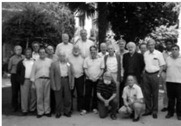
Účastníci madridského setkání