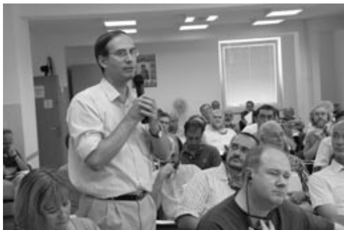
V diskusích vynikla společenská dimenze spirituality

pozitivní, jako například přátelství, láska, setkání s někým, solidarita, nebo naopak to byl nějaký šokující zážitek chudoby a zažité nespravedlnosti. Jeden francouzský jezuita to výstižně vyjádřil slovy: „To, že utrpení a bída jsou způsobeny člověkem, nelze tolerovat.“