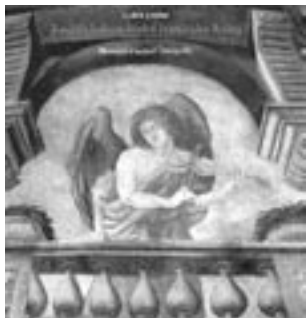
Luděk Jirásko Jindřichohradecká jezuitská kolej Jindřichův Hradec, Národní muzeum fotografie 2006

L atinsky se Jindřichův Hradec nazývá Novus domus – Nový dům. I ve starých jezuitských análech na toto označení narazíme. Jindřichohradecká kolej jezuitů přitom patřila k nejstarším kolejím, založeným ještě v 16. století před zahájením pobělohorské rekatolizace. V tomhle smyslu tedy nebyla zrovna „novým domem“. Po zrušení řádu sloužila budova koleje přes dvě stě let jako kasárna. Před několika lety se však dočkala obnovení, téměř povstala z ruin, takže nyní lze rekonstruovanou jezuitskou kolej za jakýsi „nový dům“ skutečně považovat.