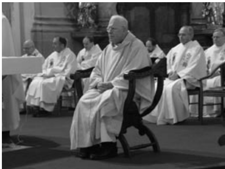
Na oslavu se sjeli spolubratři z celé provincie

vější praxe měsíčně pročíst všechna pravidla. Dělal jsem to s velkou chutí už od prvního dne noviciátu. Velký důraz se kladl na duchovní život. Pokud si někdo myslí, že když vstoupí k jezuitům, má před sebou jenom studia, vědu nebo aktivity, mýlí se. Když se přitom nevede hluboký duchovní život a nepečuje se o něj, je pro něho těžké v náporu činnosti a světského vlivu v Tovaryšstvu vydržet.