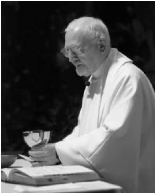
Otec Kolvenbach slaví eucharistii

Jak můžeme mluvit o návratu v době, kdy různé události poukazují na to, že Bůh nikdy ze srdcí a života lidí neodešel? Existují momenty, v kterých bychom si mohli myslet, že můžeme žít, jako by Boha nebylo, ale pak se nečekaně ocitneme tváří v tvář morální krizi a těžkostem, které není možné překonat, a tehdy nám může spiritualita náhle pomoci. Již naši předkové věděli, že beznaděj může člověka přivést k modlitbě. Upřímně řečeno, velké problémy terorizmu a hospodářského úpadku, sucha a potíže se životním prostředím by se mohly vyřešit díky technickému pokroku. Nemusíme řešit problém s rozvojem vědy a techniky, ale spíše s tím, že lidská srdce jsou uzavřená a jako z kamene. Jen vědomí přítomnosti Boha, který je pro nás láskou, může srdce proměnit a naplnit něhou. Návrat Boha, který se projevuje v různých náboženských událostech, nám připomíná, někdy sotva znatelně, ale konkrétně, že pokud Bůh nebude přebývat mezi námi, svého cíle nedosáhneme.