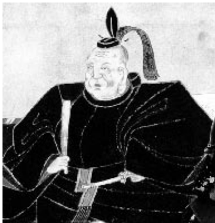
Šógun Iejasu Tokugawa (1542–1616), za jehož vlády začalo velké pronásledování křesťanů