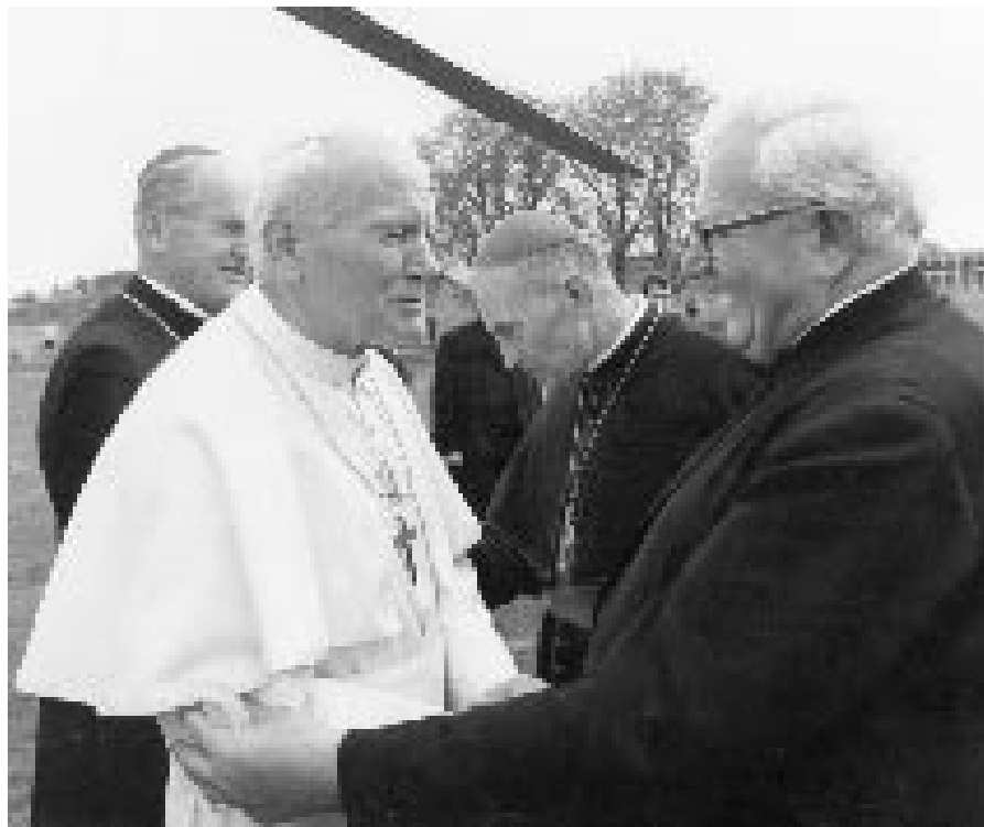
V roce 1990 přivítal otec Pavlík na Velehradě papeže Jana Pavla II.