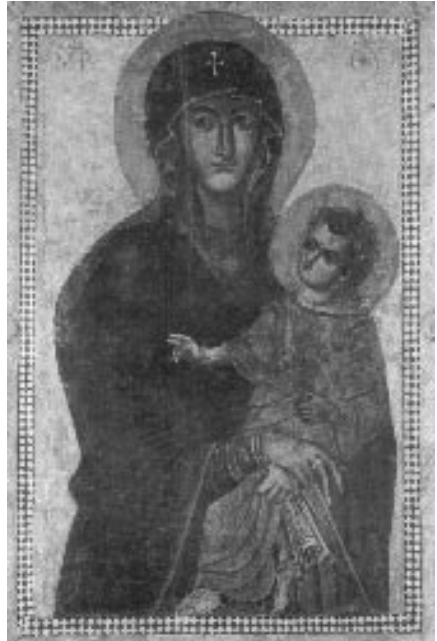
Milostný obraz Matky Boží Salus populi romani z římské basiliky Santa Maria Maggiore