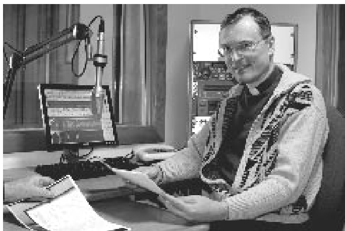
Ve studiu Vatikánského rozhlasu