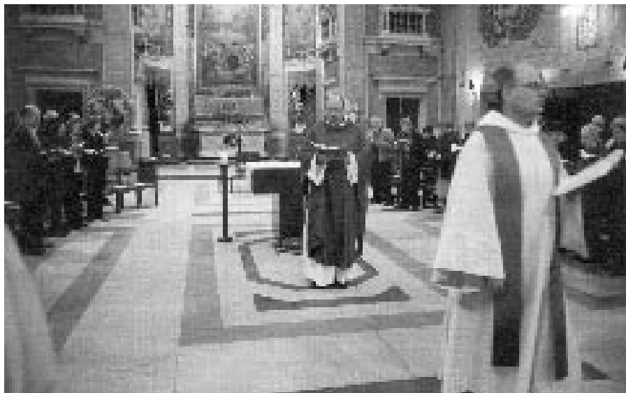
Nedělní bohoslužba v oratoři Caravita

Z magazínu Company, jaro 2009 přeložil a upravil Petr Havlíček SJ