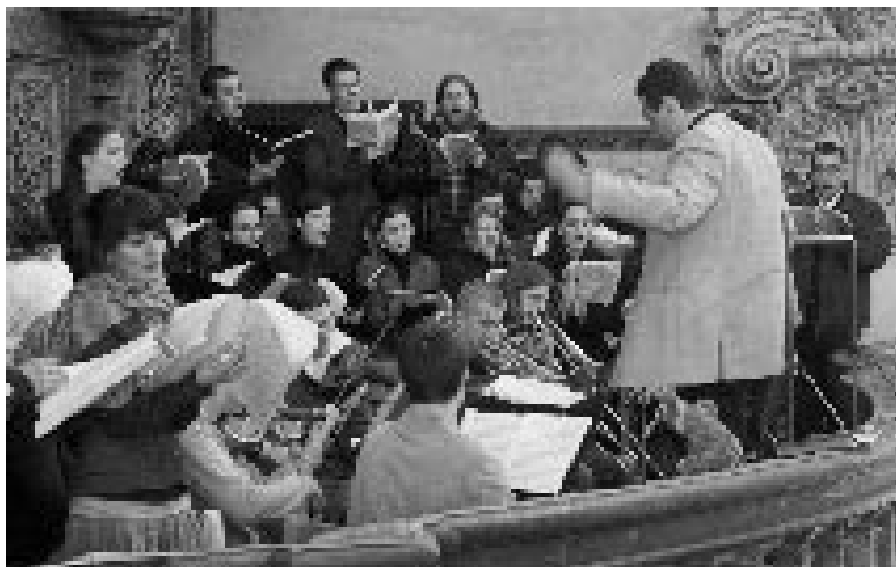
K programu sympozia neodmyslitelně patří vystoupení klatovského Kolegia pro duchovní hudbu.