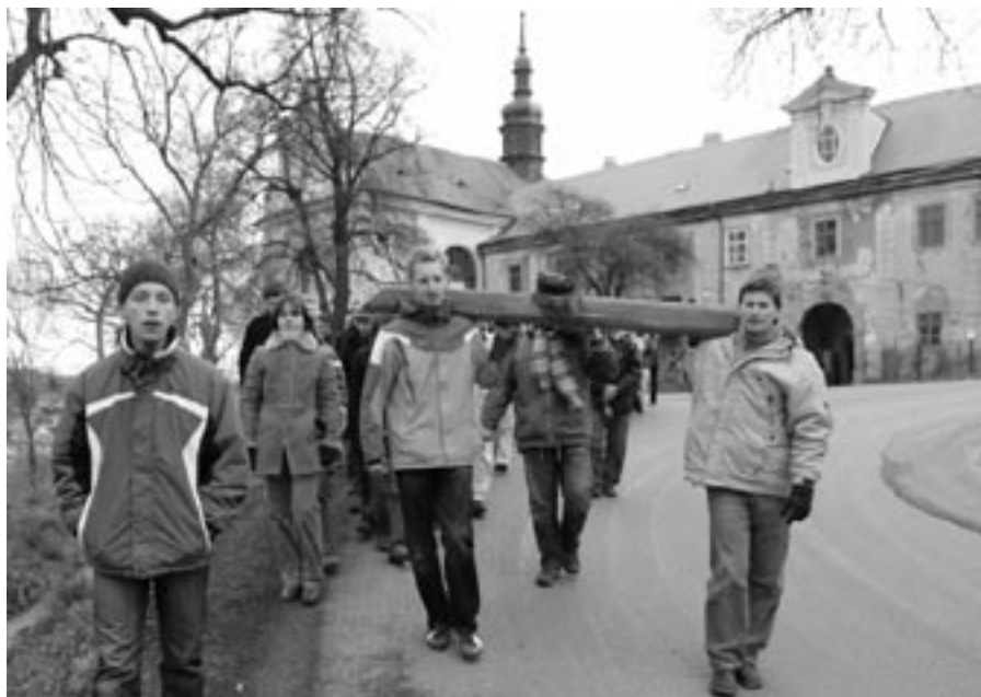
Součástí Velikonočního třídění je i křížová cesta Tuchoměřicemi