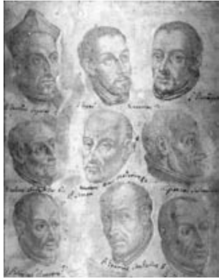
První jezuité

Ignác dbá na to, aby sdělování námitek a vyjasňování pozic při hledání Boží vůle v dialogu mezi podřízeným a představeným mělo určitou kulturu průběhu, v níž bude dávana najevo úcta mezi oběma stranami. Ze strany podřízeného doporučuje, aby své mínění předkládal poté, co uzrálo během reflexe v modlitbě, a způsobem, který o tom vypovídá. Jako vzor dává větu typu: „Promýšlel jsem věc sám i s druhými, zda by nebylo vhodné učinit věc tak a tak.“ Tento typ předkládání mínění v podmiňovacím způsobu vyjadřuje mnohem větší zralost než vyjádření typu: „Musí to být takhle.“ Kondicionální forma je projevem zralého vědomí, že představený je ten, kdo o věci rozhoduje. To ovšem nevylučuje další diskuzi ohledně tématu, i když už představený vyslovil své mínění o věci, ba i když o ní už rozhodl. Podle sv. Ignáce má smysl, aby podřízený po určitém čase, když je z dob-