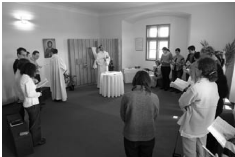
Každý den se společenství schází v domácí kapli

ní do Komunity z řad Čechů a chtěli jsme vědět, jestli nás tady Pán chce. Máme pravidlo, že domy nekupujeme, aby to nebyl jen „obchod“ z naší strany. Je pro nás znamením, je-li nám nějaký objekt nabídnut. Kdyby nás místní církev do Čech nepozvala, dnes bychom tady nebyli. V roce 1997 dostalo Arcibiskupství pražské od státu dům v Tuchoměřicích, o který nikdo kromě nás neměl zájem.