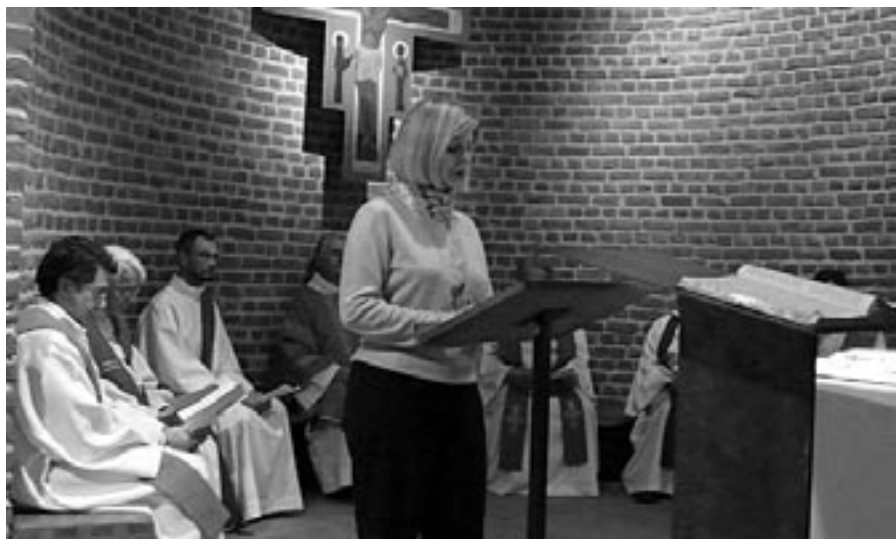
Z letošní zahajovací bohoslužby v kapli Vzkříšení

cuji pod touto mocnou ochranou a přijímají ve svém domě hosty, laiky i duchovní z celého světa, kteří přicházejí do Bruselu s otázkami týkajícími se současného velkého staveniště Evropy, ať už se jedná o otázky institučního řádu, nebo pastorační.