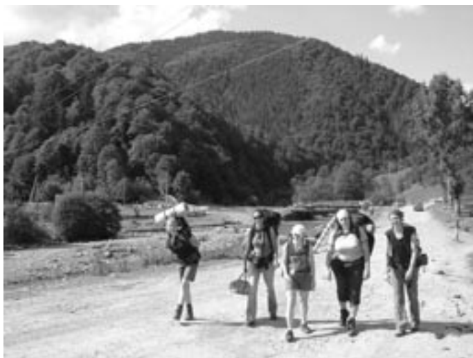
V kraji Nikoly Šuhaje loupežníka

Ve středu nás překvapil déšť. Dopoledne jsme si tedy vymysleli alternativní program – pořádně vygrun-