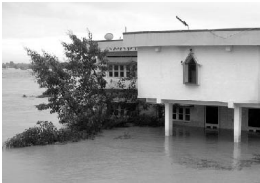
Zatopená budova jezuitské školy v Pannuru

Dárcům částek nad 1000 Kč (fyzická osoba) nebo 2000 Kč (právnícká osoba) můžeme vystavit potvrzení pro odečtení daru od daňového základu, a to na požádání na adrese Česká provincie Tovaryšstva Ježíšova – ekonomát, Ječná 2, 120 00 Praha 2, nebo na e-mailové adrese praha@jesuit.cz.