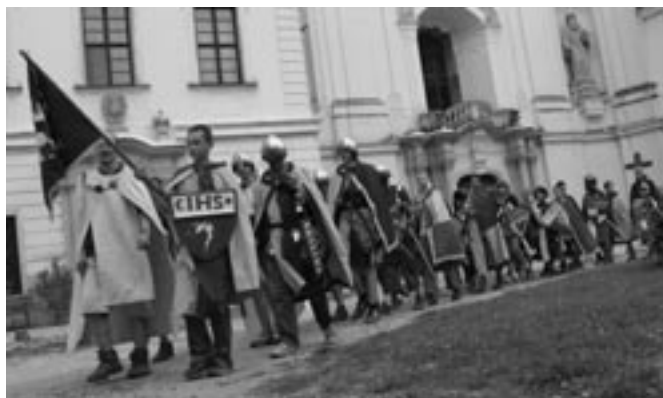
Jedna z rytířských výprav vedla až na památný Rajhrad