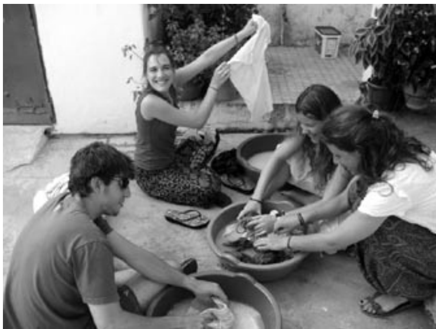
Součástí běžného života poutníků bylo i ruční praní prádla