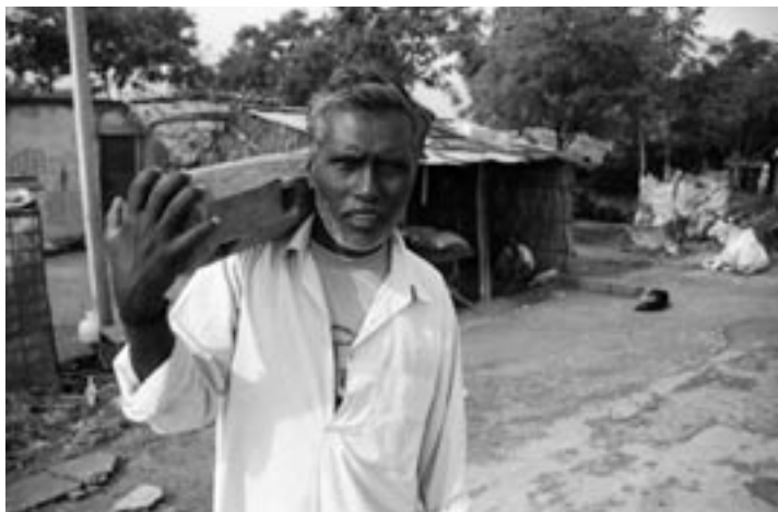
Indičtí chudí musí velmi těžce pracovat, aby si vydělali na denní chléb