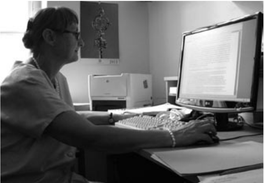
Při práci na monografii o Pavlovi z Tarsu