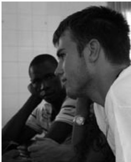
Účastníci předprogramu MAGIS 2011 měli možnost poznat různé kultury

„Poslední noc ve Španělsku jsem pak strávila na koncertě paraguayských hudebníků. Původně jsem se vydala na výstavu o jezuitských redukcích v Paraguayi, abych se – ja-