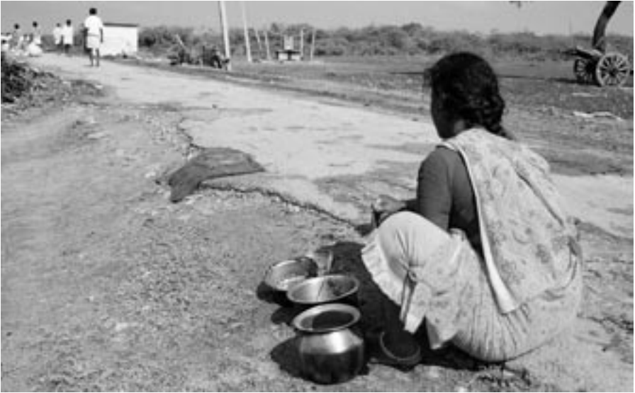
Na indickém venkově ve státě Karnátaka žije mnoho dalitů, kteří patří k nejhudším z chudých

že zlý duch nám stále našeptává, že Kristova chudoba nás vytrhává ze světa a utiskuje nás nelidským zbitičením. Jak to řekl sám náš Pán, zlý duch se stále snaží vzbudit dojem, že následováním chudého Krista „ztratíme svůj život“.