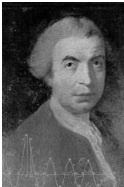
Roger Boškovič (portrét z r. 1760, R. E. Pine) a jeho křivka vyjadřující zákon sil ( lex virium )

mapu církevního státu. Roky 1757 až 1759 tráví jako znalec ve Vídni při projednávání sporu mezi Toskánskem a městem Lucca.