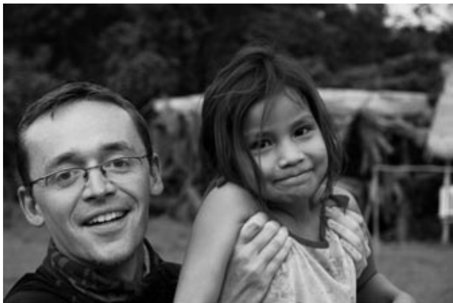
Snímek ze sociálního projektu v Amazonii