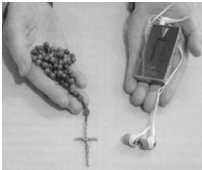
Nejen růženec, ale i MP3 přehrávač se může stát pomůckou k modlitbě, která se snadno vejde do ruky

Co dnes tento web nabízí? Na prvním místě to jsou duchovní obnovy po internetu různého typu, určené jednak pro začátečníky (trvají tři týdny), pak takové, které nabízejí duchovní doprovázení průběhem určité liturgické doby (zejména postní dobou a adventem) nebo během času prázdnin a dovolených (letní exercicie). Některé obnovy jsou určeny