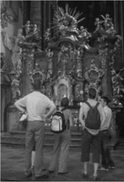
Průvodce má návštěvníku pomoci odhalit duchovní poselství díla a objevit krásu víry (Foto archiv autorky)

cetiminutové, ale na základě zájmu návštěvníka je jejich délku možno upravit. Přizpůsobují se potřebám a zájmům konkrétního turistu, takže každá nová prohlídka je svým způsobem jedinečná. Pokaždé jde především o to, aby se návštěvník cítil v kostele přijatý. Prohlídky se konají podle momentální potřeby, tedy s většími i menšími skupinami, ale i s jedním jediným turistou. Nabízeny jsou v co největším počtu jazyků, aby co nejvíce turistů mohlo být v cizině přijato ve svém vlastním jazyce.