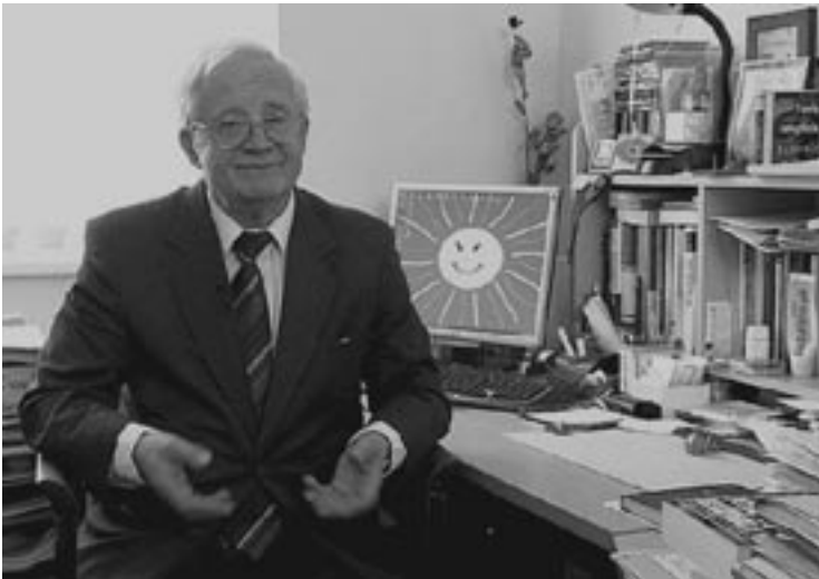
Být křesťanem znamená být pro druhé, pomáhat při zlidšťování tohoto světa