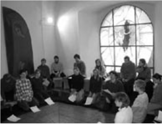
Společná meditace v kolínském exercičním domě

Nechala jsem ho, aby mě uzdravil, aby se dotkl mého zranění,“ vzpomíná na silné prožitky během meditace.