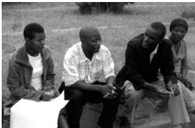
Diskuze o míru