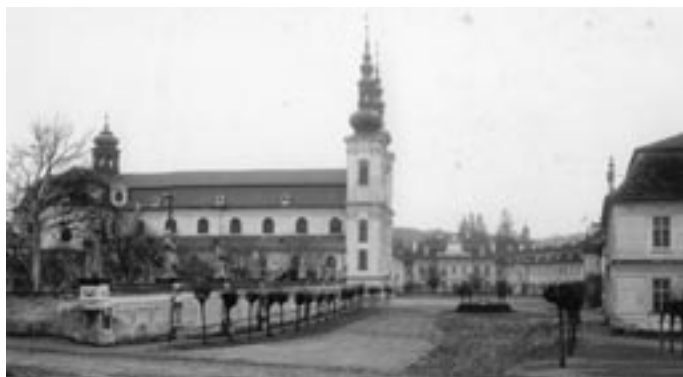
Velehrad v závěru dvacátých let 20. století

a moravských biskupů výsadu užívání staroslověnského jazyka při bohoslužbě několika památným místům českého křesťanství. Na Moravě získal tuto výsadu pouze Velehrad. V Čechách byla takto vyznamenána Svatá Hora u Příbrami, sázavský a emauzský klášter, Vyšehrad, kaple sv. Václava a hrob sv. Jana Nepomuckého ve svatovítské katedrále v Praze, hrob sv. Ludmily v kostele sv. Jiří na Pražském hradě a bazilika sv. Václava ve Staré Boleslavi. K těmto devíti místům přibyl v roce 1921 ještě chrám sv. Cyrila a Metoděje v Praze-Karlíně zvláště vyžádaným privilegiem. Každý latinský kněz, který uměl staroslověnštinu, tedy mohl sloužit na těchto místech hlaholskou mší, a to o pěti svátcích českých patronů: sv. Cyrila a Metoděje, sv. Václava, sv. Ludmily, sv. Prokopa a sv. Jana Nepomuckého. V emauzském klášteře a na Sázavě bylo možné slavit hlaholsky také svátek sv. Vojtěcha.