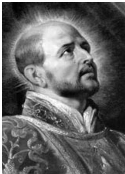
Detail Rubensova obrazu Ignáce z Loyoly (Repro foto)

že sám Bůh jej učil. Říká: „Bylo to pro jeho nechápanost, nebo protože neměl nikoho, kdo by ho poučoval, anebo díky pevné vůli sloužit Bohu, kterou do něj vložil sám Bůh (Autobiografie, č. 27).“ Naznačuje, že Bůh svým Duchem dokáže vést nejen pokročilé osobnosti obdařené mystickou zkušeností (to jsou ti s pevnou vůlí mu sloužit), ale i „nechápané“ začátečníky. Ignác je pevně přesvědčen, že za obrácením člověka ke Kristu, aťsi je to na úplném začátku, a třeba i smíšeno s různou lidskou zbrklostí, nezralostí a slabostí, stojí mocná Boží milost, která mu dokáže udávat podstatně správný směr.