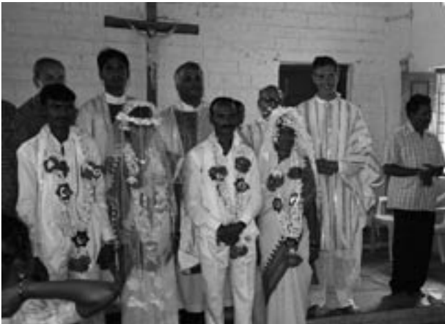
Zvláštní příležitostí k radosti byly hromadné svatby