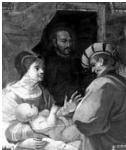
Na přímluvu sv. Ignáce se stalo mnoho zázraků

Když mniši hovoří o smyslu svého odloučeného života a jak se slučuje