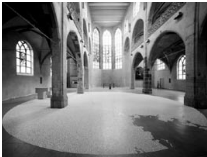
Umělecká intervence japonského umělce Motoie Yamamoty v jezuitském kostele sv. Petra v Kolíně nad Rýnem

Setkání s německým jezuitou bylo pro mne v první řadě výletem do světa současného umění, přesněji k těm jeho hloubkám, kde se znovu otevírají ty nejzákladnější lidské otázky, otázky, mezi kterými má místo i ta po smyslu a možnostech transcen-