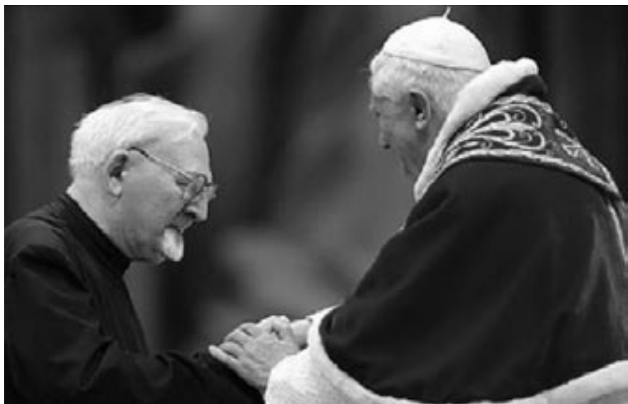
Bývalý generální představený jezuitů Peter-Hans Kolvenbach na audienci u papeže Benedikta XVI.

Hlavním rozlišovacím kritériem je větší všeobecné dobro. Uplatňuje se v něm další z rysů Ignácovy spirituality, jímž je princip magis , tedy schopnost volit si to, co více slouží Bohu, co vede k jeho větší oslavě ( ad maiorem Dei gloriam ). Důraz na větší všeobecné dobro je vodítkem i v napětí, které je charakteristické pro naši dobu, totiž mezi globální a místní úrovní skutečnosti. Vize sv. Ignáce byla od počátku a bez rozpaků celosvětová: „Podle našeho povo-