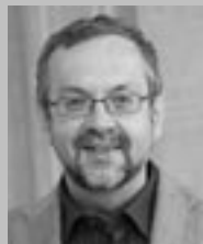
Zbyněk Matějů hudební skladatel

Ona ambivalentnost mého vztahu ke kreativě pramení právě z period „racionálního“ prozření, kdy jsem pochopil, že je nutné mít seriózní zaměstnání, než jsem podlehl nepřekonatelnému puzení k vlastní tvůrčí činnosti.