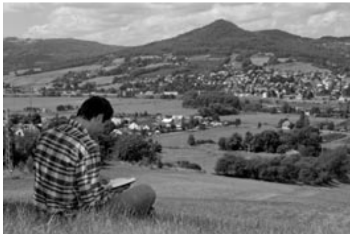
Při modlitbě rozmlouváme s Bohem jako s přítelem

Duchovní cvičení jsou strukturována okolo rozvoje vztahu mezi exercitantem a Ježíšem Kristem. Nabádají nás, abychom se viděli tak, jak nás vidí Bůh – jako jeho synové a dcery,