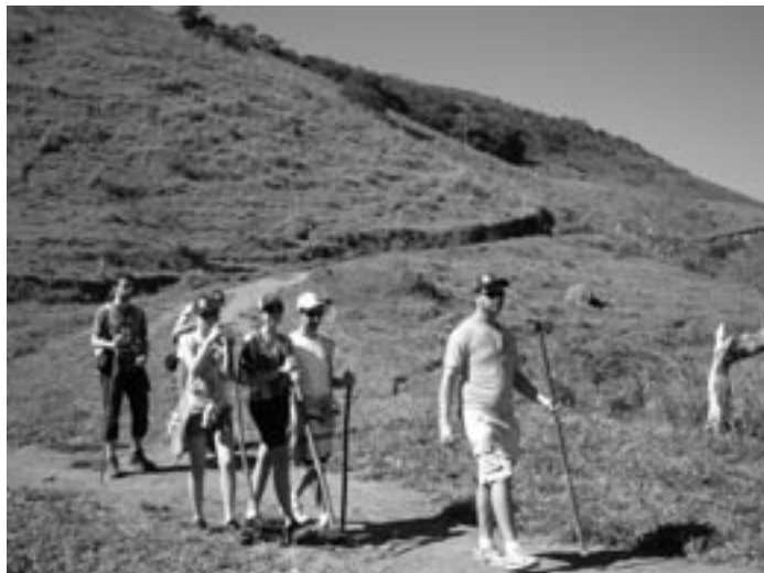
Poutníci měli možnost poznat brazilskou přírodu. Věrným průvodcem jim byly pravé bambusové hole

voláváním jednotlivých zemí jako před finále extraligy. Zanechala ve mně dojem někde mezi návštěvou fotbalového stadionu a cirkusu,“ popisuje své pocity Ladislav Čepelka.