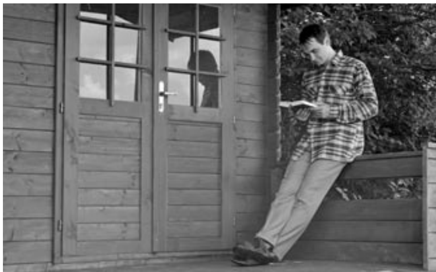
Jezuité se většinou modlí breviář o samotě, ale přitom v jednotě se svými spolubratry

jako chvíli spojení v modlitbě se svými spolubratry v komunitě. Kartuziáni toto vzájemné spojení prožívají tím, že se modlí současně ve stejnou dobu po zaznění zvonu. Jezuité sice nemají stanovený čas, kdy se během dne modlit breviář, přesto ale platí tentýž vztah – modlím se v jednotě se svými spolubratry, s nimiž žiji pod jednou střechou.