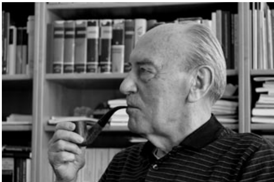
Kontemplace je ve své podstatě náš vědomý vztah k Bohu

lity nám nabízejí celou paletu metod, jimiž se můžeme nechat inspirovat. Asiáté nás Evropany často kritizují, že jsme příliš „cerebrální“ (rozumoví), máme prý při modlitbě tak velkou hlavu, že neprojdeme dveřmi. Určitě by nám prospělo, kdybychom se při modlitbě snažili tu svou velkou hlavu vyprázdnit, aby měl Pán Bůh kam vstoupit.