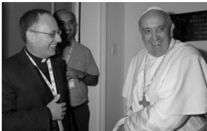
Rozhovor Antonia Spadara s papežem Františkem se nesl ve velmi neformálním a přátelském duchu

Nedůvěřuji rozhodnutím přijatým bez rozmyslu. Musím čekat, vnitřně hodnotit a vzít si potřebný čas. Moudré rozlišování vyvažuje nevyhnutelnou dvojznačnost života a umožňuje najít nejvhodnější prostředky, což nejsou vždycky ty, které se zdají velké nebo mocné.