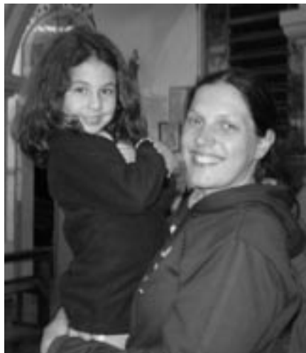
Brazílské děti k nám rychle přilnuly. A my k nim také

pláž pozvolna probouzela, se mraky rozestoupily a asi na hodinu daly vyniknout vycházejícímu slunci. Celou pláž v tu chvíli naplnil nadšený potlesk statisíců mladých lidí z celého světa, kteří vítali slunce s radostným úsměvem, jako vzácného hosta, jako Krista, jehož láska přináší světlo do tmy a pochmurna našich životů.