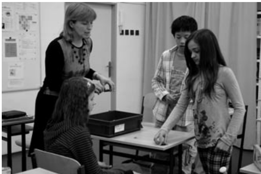
Pracovníci školy se snaží vytvořit bezpečné prostředí, ve kterém se může rozvíjet tolik citlivá dětská duše, vzpomíná Jiří Hebron na Nativity