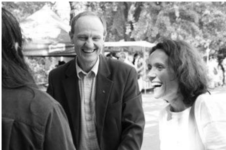
Z prvního ročníku Svatojánské pouti na Karlově náměstí v Praze

sius procházel Evropou jako vesnicí, v níž je co budovat, Teilhard de Chardin byl schopen vidět stamiliony let tam či zpět. Tato otevřenost Tovaryšstva, personifikovaná ve většině jezuitů ochotou jít kamkoliv a dotýkat se čehokoliv božsko-lidského, to mne před třiceti pěti lety vtáhlo a doposud živí vděčností a stále okysličuje mou slabou paměť. Tedy není tak lehké a příjemné cestovat sem a tam. Ale je úžasné potkávat se se spolubratry různých národů a kontinentů a vnímat stejného ducha velkorysosti.