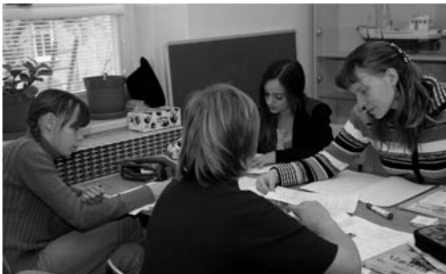
Podle ignaciánské pedagogiky má učitel stát žákovi nablízku při jeho postupném objevování pravdy

setkání s živou pravdou a na zkoumání smyslu lidského života.