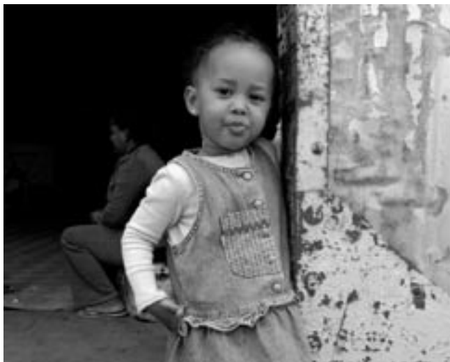
Jedno z dětí v utečeneckém táboře, ve kterém působí Jezuitská služba uprchlíkům

Já jsem při svém pobytu na Maltě vypomáhal zejména ve dvou oblastech – každé pondělí v příjmu klientů v kanceláři JRS, a dále v rámci činnosti pastoračního týmu. Příjem klientů v mém případě obnášel zejména pomoc při sepisování profesního životopisu, který výrazně pomáhá při hledání zaměstnání. Nebyla to jen úřednická práce, šlo o nejbezprostřednější osobní kontakt se širokým spektrem klientů.