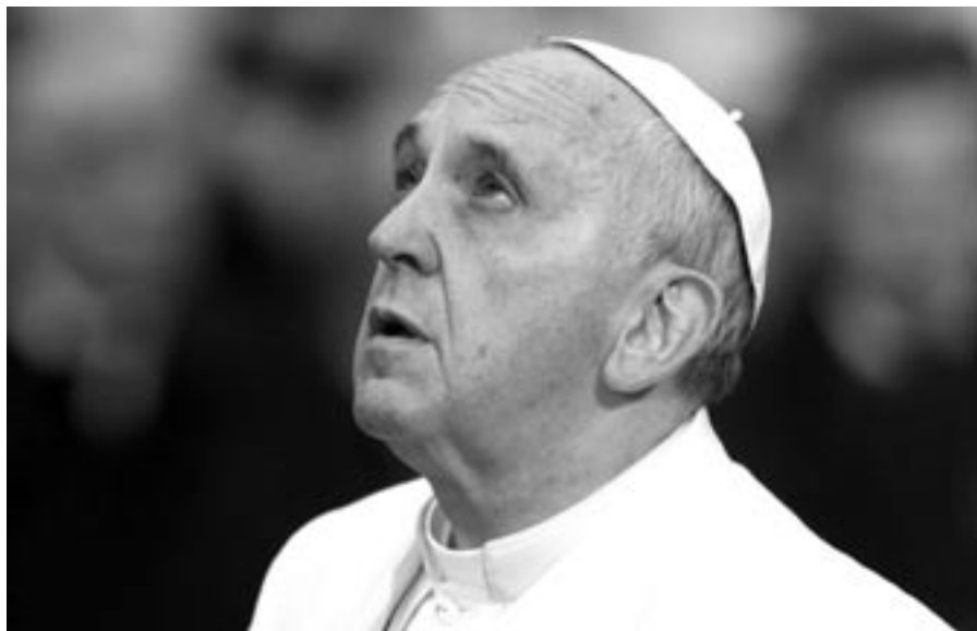
„František veřejně přiznal, že papež nemá odpovědi na všechny otázky a že k tomu, aby mohl vykonávat svou funkci, sám potřebuje neustálý dialog,“ uvádí jezuitský historik

Na papeži Františkovi je velmi atraktivní jeho smělost a odvaha. To pro něj bylo příznačné v Argentíně a je tomu tak i nyní ve Vatikánu. Jedna z mých