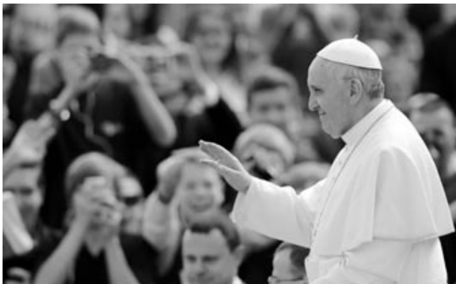
Papež František není nějakou povrchní globální celebritou, ale především duchovní autoritou, respektovanou nejen mezi věřícími

sv. Pavla: „Projevujte navenek milosrdné srdce, dobrotu, pokoru, mírnost a trpělivost. Snášejte se a navzájem si odpouštějte, má-li kdo něco proti druhému. Pán odpustil vám, proto odpouštějte i vy“ (Kol 3,12–13). V místě, které se kdy si stalo svědkem bratrovražedných bojů, papež spojil tuto myšlenku s blahoslavenstvím, které oslavuje „tvůrce pokoje“. Pokoj je třeba dle jeho slov budovat v každodennosti, všude tam, kde žijeme. Je však také darem Božím. „Jedině nechá-li se člověk smířit s Bohem, může se stát tvůrcem pokoje,“ dodal papež.