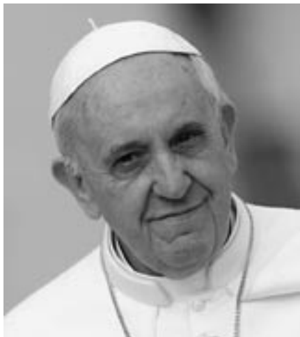
Františkovou obzvláštní zásluhou jsou jeho časté a výmluvné přímluvy za uprchlíky

níci: jedni nasloucháním a druhí kázáním.“ Homilie je pro papeže dialog Pána s jeho lidem, vždyť „kazatel má nádherné a obtížné poslání sjednocovat srdce, která se milují: srdce Páně se srdci jeho lidu“. Papež zde dokonce navrhuje způsob, jak se mají kazatelé připravovat na svá kázání. „Nedělní čtení se v plné nádheře rozezná v srdci lidu, pokud se takto rozezněla nejprve v srdci pastýře.“