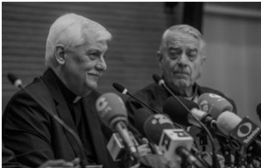
Nový generální představený jezuitů P. Arturo Sosa (vlevo) během své první tiskové konference

Jistě je to důsledek změny, která se dotýká celé církve, a znamená její katolicity, jak to bylo zřejmé při konkláve, které zvolilo Bergoglia. Chci ale zdůraznit nepopíratelnou a velmi důležitou historickou skutečnost: umožnila to misionářská velkorysost Evropanů, která také podporovala predispozici k inkulturaci, jež je typická pro jezuitu a jejich misie. Proces trval více než jedno a půl století a Tovaryšstvo se díky němu stalo multikulturní realitou, která tvoří součást desítek kultur, aby lidem a společnosti ukazovala Ježíše Krista, tvář Boha, a pomáhala jim být lidštějšími. To představuje ohromné bohatství pro jezuitu a pro všechny církve – jako je církev v Latinské Americe, která je velmi živá a často neprávem zplošťovaná na teologii osvobození, jež byla nezdůvodněně představena v karikaturní podobě jako marxistická.