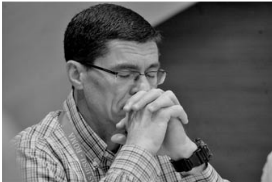
Hlavní motivací duchovního povolání je touha po Bohu

nechali sítě a šli za ním (Mk 1,18-20; Mt 4,18-22)“. A třetí je být apoštolem: „Potom vystoupil na horu, zavolał k sobě ty, které sám chtěl, a oni přišli k němu. A ustanovil jich dvanáct, aby byli s ním, protože je chtěl posílat kázat... (Mk 3,13-15; Lk 6,12-16; Mt 10,1-4).“ V evangeliu jsou ale uvedeny i situace, kdy zájemci o následování jsou odmítnuti. Jejich životní úloha je jiná (Mk 5,1-20; Lk 8,38-39).