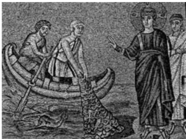
Ježíš povolává rybáře Petra na starokřesťanské mozaice z baziliky v Ravenně