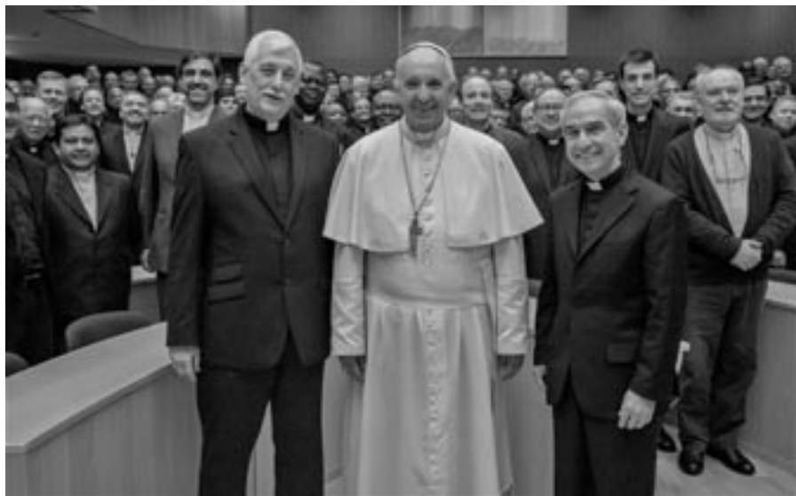
Papež František s delegáty 36. generální kongregace