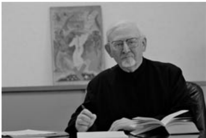
Otec Peter-Hans Kolvenbach ve své pracovně

Dne 2. února 2006, ve svých sedmdesáti osmi letech a po bezmála dvaceti pěti letech v čele Tovaryšstva, svolal na počátek roku 2008 35. generální kongregaci, na níž kvůli pokročilému věku rezignoval na svou funkci. Delegáti kongregace 14. ledna 2008 jeho rezignaci přijali a o pět dní později zvolili jeho nástupcem P. Adolfa Nicoláse. Pater Kolvenbach se vrátil do Libanonu, kde se stal členem řádové komunity v Bejrútu. Pracoval jako pomocný knihovník a archivář na univerzitě sv. Josefa a věnoval se různým témům z oblasti arménského jazyka a literatury. Zemřel v Bejrútu po krátké hospitalizaci v sobotu 26. listopadu 2016 večer, několik dní před svými osmaosmdesátými narozeninami.