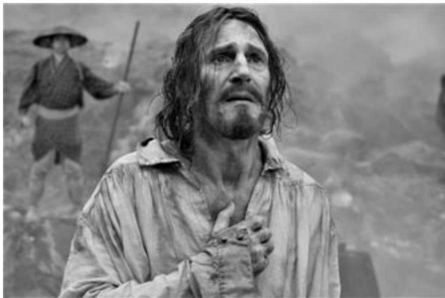
Herec Liam Neeson jako otec Ferreira ve filmu Mlčení