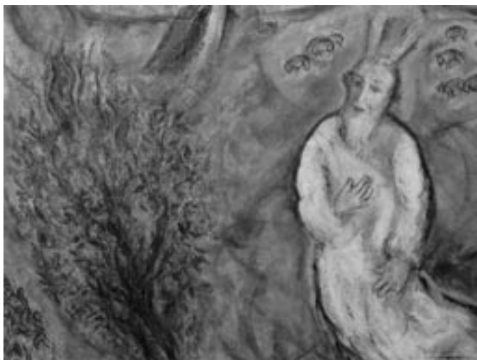
Mojžíšovo setkání s Hospodinem v hořícím keři na obrazě Marka Chagalla

V evangeliích se vše soustředí na Ježíše. Jeho poslání obvykle bereme jako samozřejmé a bezproblémové, vždyť byl přece Boží Syn, a tak měl