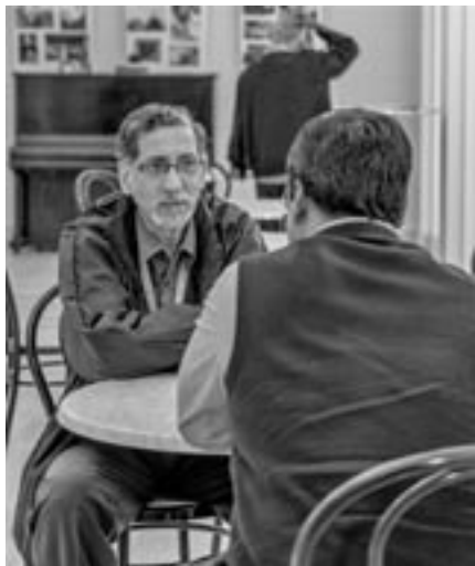
Hledání povolání má podobu dialogu

Slovo povolání je odvozeno od slovesa volat. Tím se naznačuje, že Bůh nejprve působí mimo nás, že nás zve a mluví k nám. Zároveň si uvědomujeme, že toto působení nemůžeme pominout. Odpovídáme na ně buď ano, či ne. Ignorovat ho znamená říci ne. Věříme, že Bůh každého z nás volá ke konání dobrých věcí ve světě. Jsme voláni k tomu, abychom měli zájem o jiné lidi, k tomu, abychom se