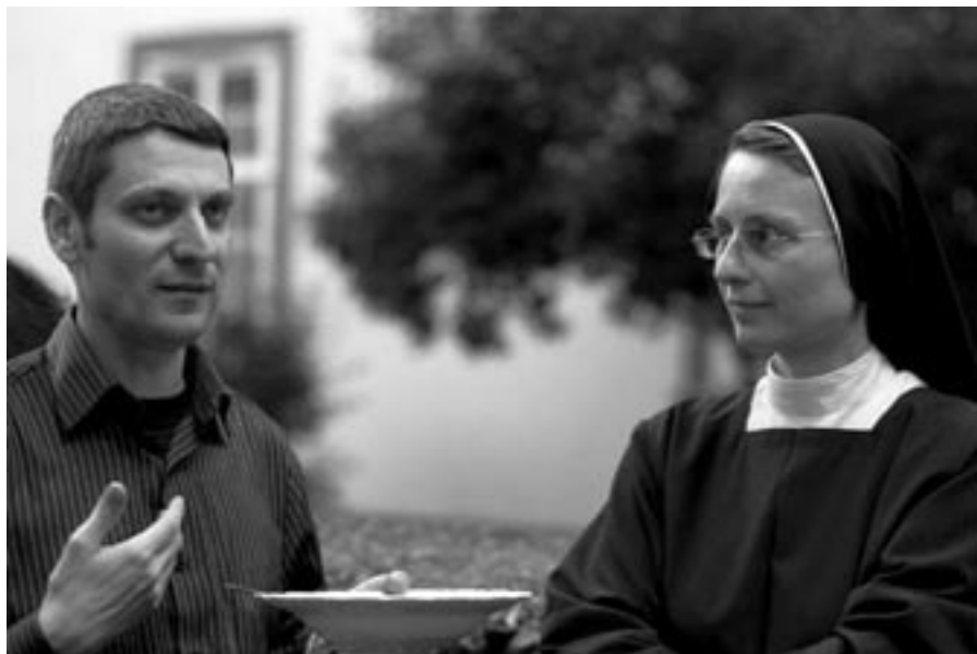
Může být pro nás užitečné uvažovat o různých konkrétních cestách, které by mohly naplnit naše nejhlubší povolání v současném světě

Když procházíme jednotlivými stupni rozlišování, procházíme také různými vnitřními zkušenostmi. Některé jsou skutečně velmi zvláštní. Je proto dobré vědět, že mnozí lidé měli už dávno před námi podobné zkušenosti, když se pokoušeli nalézt své životní povolání. Zde jsou některé z těchto zkušeností, které ovšem nemusíme nezbytně prožívat stejným způsobem: moment překvapení, pocit zmatku a pokory ve vztahu k Bohu; vědomí, že jsem doprovázen a je o mě postaráno; vědomí hříšnosti a nehodnosti; vědomí naprosté otevřenosti sloužit Bohu a lidem; velká