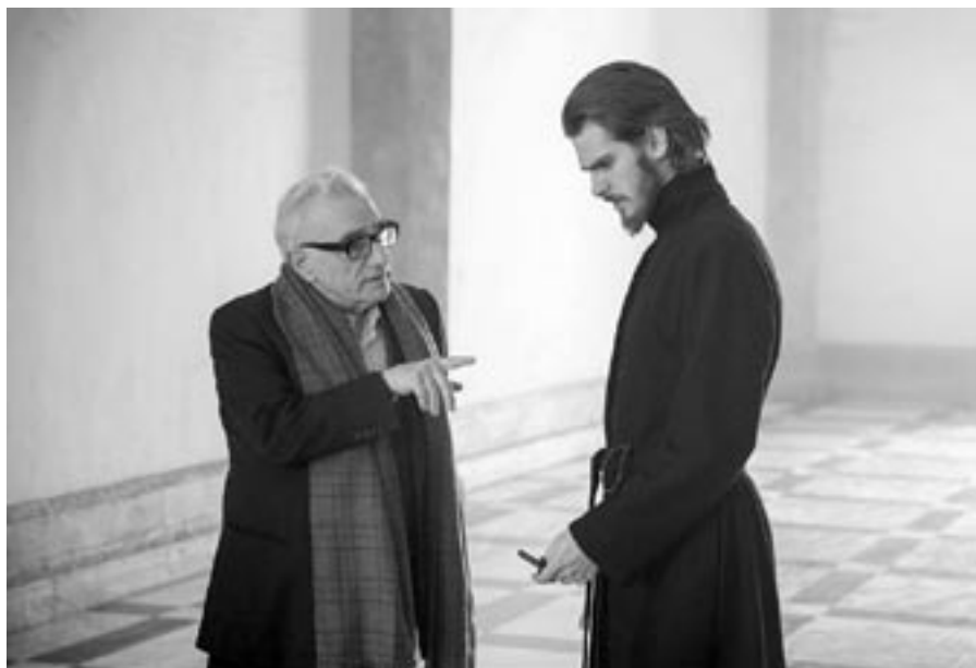
Režisér filmu Mlčení Martin Scorsese s představitelem hlavní role Andrewem Garfieldem při natáčení snímku

plný čin od svého kněze, což pro křesťanské diváky může být matoucí. Nikomu ten čin nedává smysl, tím méně Rodriguesovi, který mu sám dlouho odolával. Přesto jej vykoná, protože ho o to Ježíš požádal.