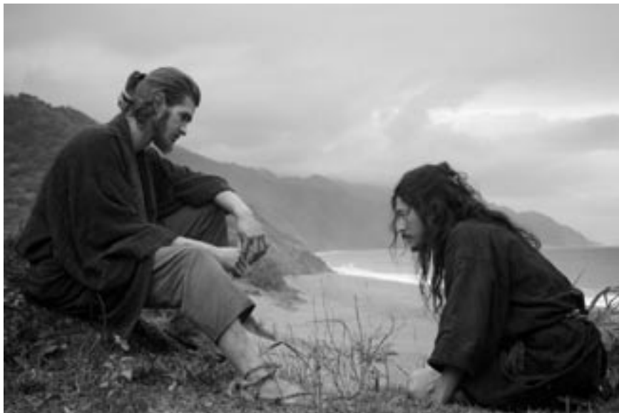
Film Mlčení medituje nad tématy zrady, odpuštění a možnosti nového začátku

kteřý bude kvůli němu zesměšňován a tupen. A proč vůbec, když už si on sám jednou zemřel, to žádá i po druhých, když už jednou oběť byla naplněna! Po dlouhém Pánově mlčení se dovídáme, že je to kvůli tomu, abychom byli šťastní, a že tato konkrétní podoba plnosti překračuje jakoukoli naši úvahu o štěstí. Bez tvořivého mlčení by byl Pán pořád jen součástí našich vlastních slov.