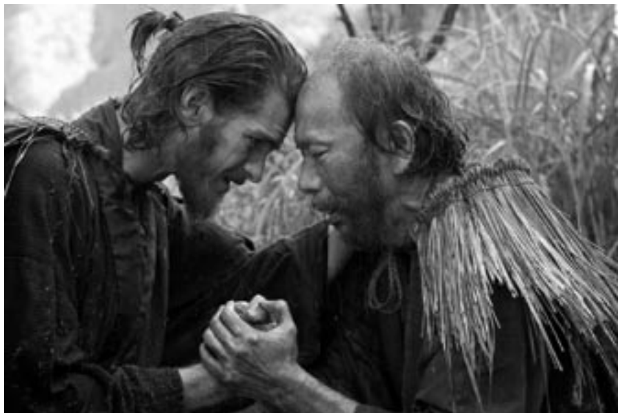
Na daleké misijní cesty se jezuité vydávali z lásky k Bohu a k lidem

Kde byl Bůh, když byli japonští křesťané mučeni a ukřižováni? Řekl bych: s nimi, blízko nich, vedle nich, a přihlížel s takovou úzkostí, s jakou Rodrigues a Garupe přihlíželi ukřižování svých přátel v oceánu.