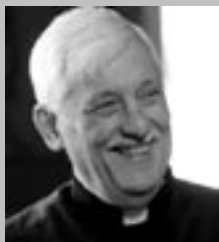
Arturo Sosa generální představený z rozhovorů z října 2016

Jezuity jsem poznal na škole a nikdy jsem nepochyboval o svém povolání do jezuitského řádu. Dokonce jsem si to v myšlenkách nikdy nespojoval s kněžstvím, ale prostě jsem se chtěl stát jezuitou. Mé povolání vděčí za mnohé právě bratrům-učitelům. Skutečně, když si tu dobu připomínám, ti jezuité, kteří na mne udělali největší dojem, byli bratři. Tehdy bylo ve venezuelské provincii mnoho bratří. Byli mezi nimi například kuchaři, opraváři autobusů, řidiči... a také učitelé. Na základním stupni učili především bratři a byli to skvělí pedagogové. Právě bratři a scholastici nám byli nejbližší. Mnohokrát jsem oněměl před zkušeností, kterou tito bratři – řeholníci, ale ne kněží – měli s Bohem. Zvláště si pamatuji jednoho z nich, který se po celý svůj život staral o zvířata na statku: žil kontemplativně.