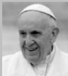
Papež František vystoupení na 36. GK

Moje zkušenost s bratry byla vždy velmi pozitivní. Bratři, se kterými jsem se setkal jako student, byli velmi moudří muži. Měli moudrost odlišnou od moudrosti scholastiků a kněží. Dokonce i dnes bratři, kteří jsou hodně studovaní a zastávají vedoucí pozice, mají nějaké „zvláštní kouzlo“ odlišné od kněží. A já si myslím, že by se ta zvláštní sapienciální kvalita, která má svůj původ v bytí bratrem, měla zachovat. U velkých bratrů, které jsem znal, na mne zapůsobil jejich „šestý smysl“, třeba když říkali: „Dávejte pozor na toho otce, zdá se mi, že potřebuje zvláštní pomoc.“ Často byli velmi diskretní. A pomáhali! Dříve než jakýkoliv jiný člen komunity si právě bratr uvědomil, co se děje. Nevím, jak to vyjádřit, myslím, že je v tom zvláštní milost. Je třeba hledat Boží vůli s bratry v tomto okamžiku a snažit se nalézt způsob, jak ji vyjádřit.