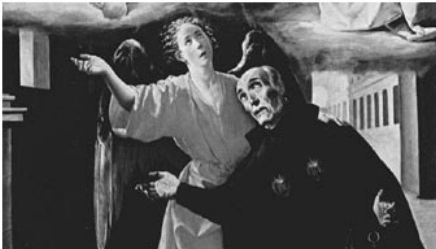
Jedno z mystických vidění Alfonse Rodrigueze zachycené na obraze španělského malíře Francisca de Zurbarán z roku 1630