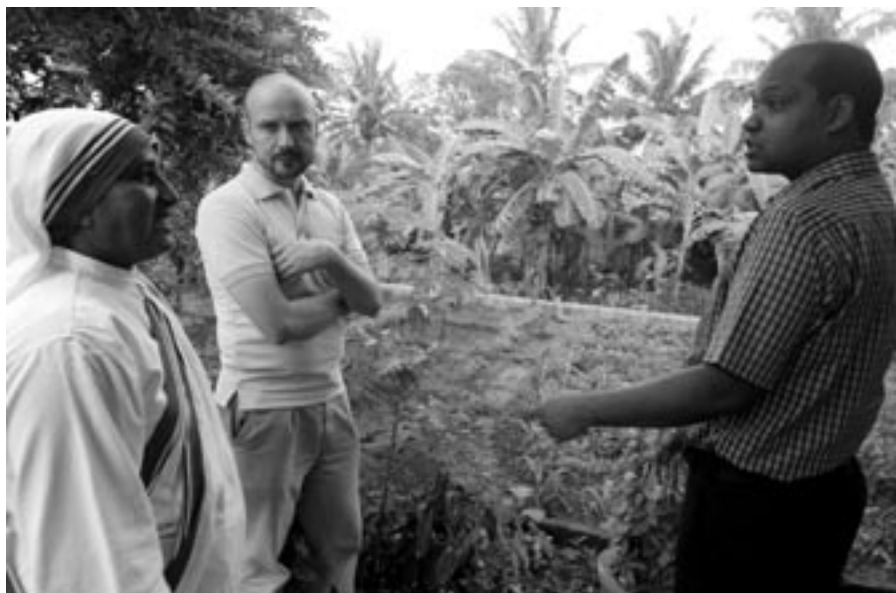
Na návštěvě u misionářek lásky krátce po svatočeení jejich zakladatelky Matky Terezy

v přírodě k vidění i celé klany někdy dost drzých a útočných opic. Kromě cvrkotu cikád a zpěvu ptáků, které působily spíše libě, se v zahradě bohužel rozléhal i hluk z nedaleké silnice, různé lidové veselice, hudba z amplionů, v noci štěkání psů a kolem čtvrté ráno i nekonečné zpěvy buddhistických mnichů, které šíří tlampače do dalekého okolí. Místní lidé jsou na hluk zvyklí, a zdá se, že ho někdy i vyhledávají. Projevuje se to i při liturgických oslavách, které mají tradičně spíše folklorní kolorit.