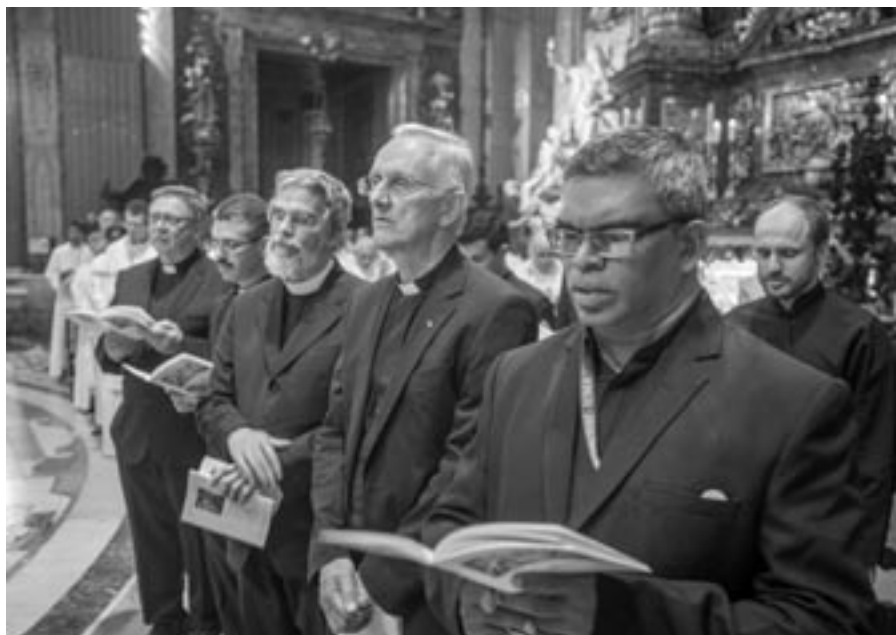
Zástupci jezuitských bratrů z celého světa při zahajovací mši 36. generální kongregace 2. října 2016 v kostele Il Gesù v Římě

ři ztělesňovali různorodost povolání bratrů. Byli mezi nimi duchovní doprovázející, sekretář provinciála, provinční ekonom, učitelé i ředitel Vatikánské observatoře.