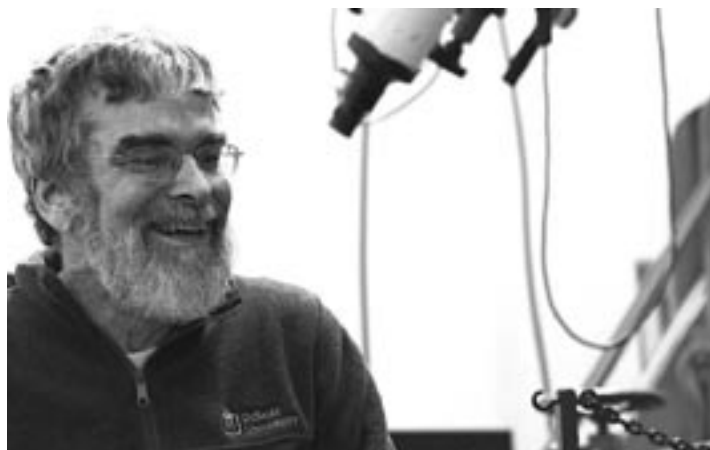
Práce ve Vatikánské observatoři dává vědcům svobodu, říká ředitel této instituce

Jsme malá skupinka přibližně dvanácti kněží a bratří, většinou jezuitů. Na různých světových univerzitách jsme se specializovali v některém odvětví astronomie a nyní pracujeme na vlastních vědeckých projektech s kolegy a spolupracovníky z observatoří z celého světa. Máme stejné vzdělání jako každý jiný astronom, rozdíl je jen v tom, že jakožto jezuité studujeme také filozofii a teologii. V tomto smyslu se bádání na našem pracovišti nijak neliší od práce v jiných observatořích. Existují tu však i některé podstatné rozdíly.