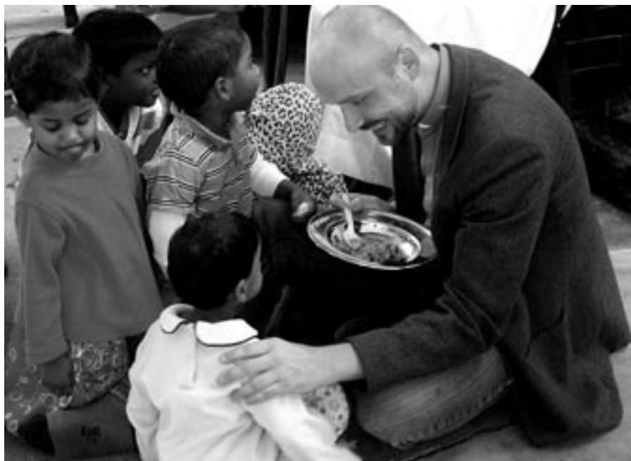
Na oslavě svátku Pongal, který odpovídá našim dožínkám, se připravuje pokrm z čerstvé rýže, rozeinek, burských oříšků a dalších ingrediencí, jež šrilanským dětem velmi chutná

Velmi silně na mě zapůsobila zkušenost měsíčních duchovních cvičení. Byl to opravdu milostivý čas usebranosti a ztišení. Po skončení exercicií nás ještě čekal několikadenní volnější režim, abychom mohli plně docenit a vstřebat duchovní plody, kterých se nám během uplynulého měsíce tichého usebrání dostalo. Následujícím listopadovým tématem byly vybrané kapitoly z dějin jezuitského řádu, po nichž jsme vy-