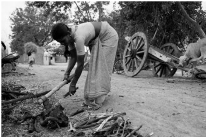
Chudoba dalitů v indických vesnicích je dodnes tíživá

vinutější systémy sociálního zabezpečení jsou plodem sociální nauky církve. Stojí však na prahu změny epochy. Ta nás učí myslet globálně a jednat lokálně. To podstatné je řečeno způsobem vskutku prorockým v encyklice o bratrství a sociálním přátelství Fratelli tutti . Kde začít? V srdci, jež je ochotno naslouchat slovu. Neohrožují nás systémy, nýbrž zatemnění srdce. Někdy i hrozně tvrdé!