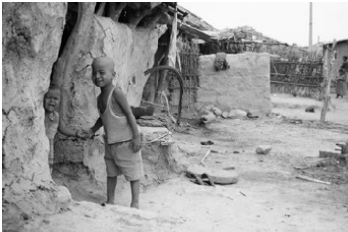
Z misijní výpravy mladých jezuitů a dobrovolníků v indické Karnátace v roce 2008

jiného než z toho, že se raduje. Chudoba v Ignácově pojetí je onou výsadní radostí někoho, kdo zůstává s Pánem jen pro něj samotného. Když někdo lpí na majetku, vždy ho to dovede k tomu, že je o radost oloupen zlodějem, jehož si ani nevšimne.