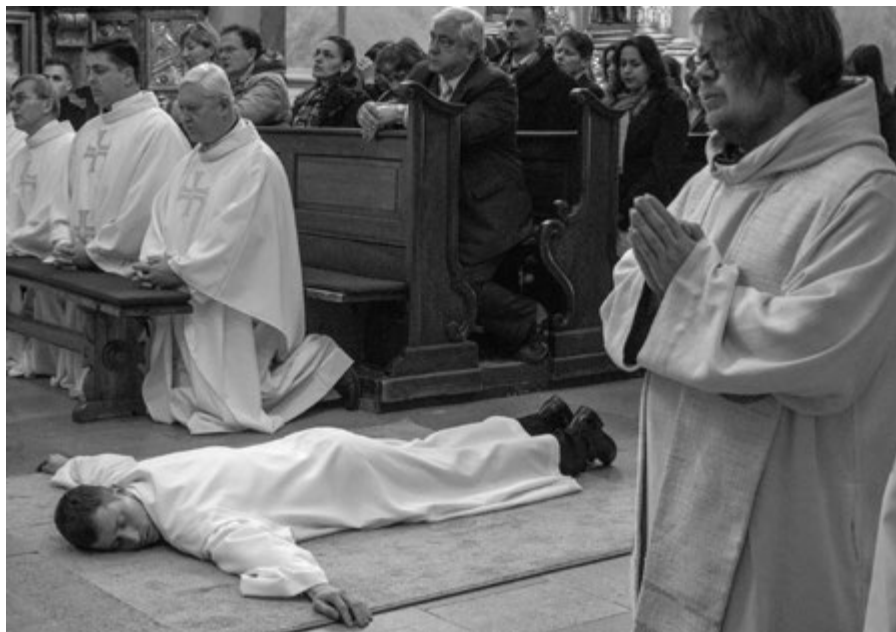
Prostrace je nejvyšší formou úcty k Bohu. Svěcenec si lehá na tvář před oltářem, často s rozpaženými rukama, ve tvaru kříže tak vyjadřuje úplné sebedarování a naprostou vydanost