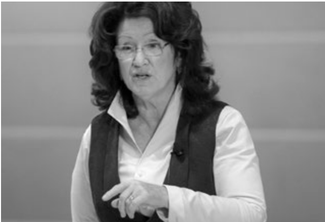
Psycholožka Sue Johnsonová patří k významným představitelům terapie zaměřené na emoce

Slovní spojení „bezpečné pouto“ ( bonded attachment ) mě zaujalo: Pokud zdravé, bezpečné pouto k druhé osobě zvyšuje šance na zvládnutí bolesti života, dalo by se to nějak aplikovat na vztah k Bohu? Zdálo se mi, že je to důležitá otázka, kterou bych si měl položit. Koneckonců jsem byl křesťan. Uvažoval někdo z velkých duchovních spisovatelů nebo myslitelů víry o vztahu k Bohu v souvislosti se závislostmi?