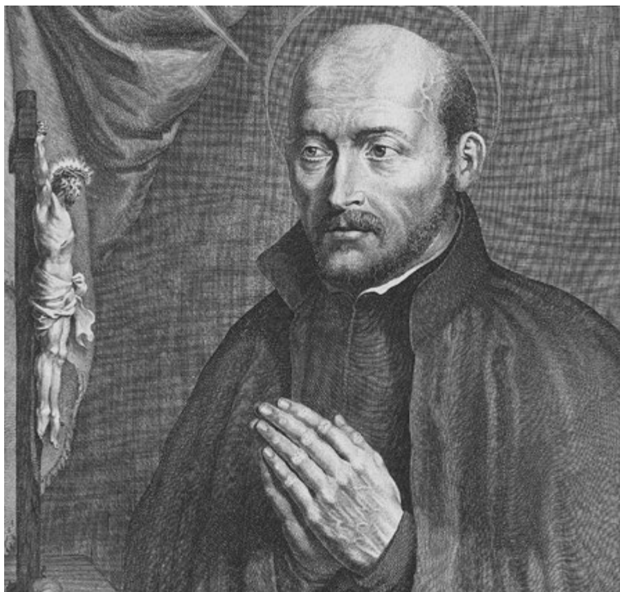
Ignác z Loyoly si postupně osvojil chápání chudoby jako vyjádření svobody od zajištěnosti, jako vydanosti do Božích rukou, a zároveň jako štědrosti

se navzájem podporují. Jednak chudoba činila jejich kázání Krista věrohodným, takže mnoho posluchačů pohnula k obrácení. A zároveň apoštolská obětavost, ochota být lidem k dispozici působila, že dostávali dostatek almužen na živobytí, oproti tomu, když předtím pouze chodili po žebrotě dům od domu.