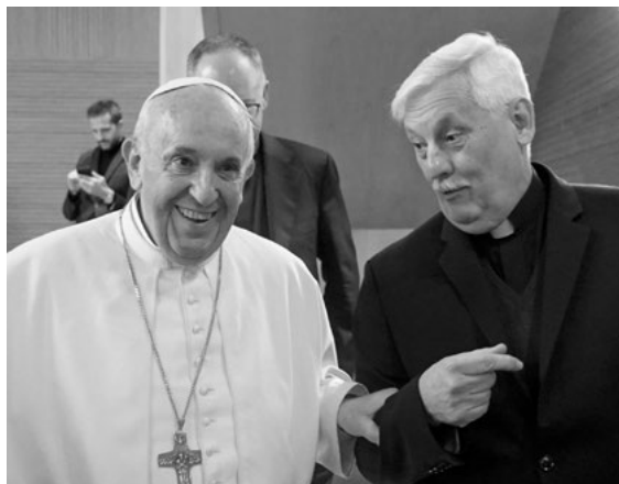
Generální představený jezuitů Sosa s papežem Františkem

církev je instituce, která se potřebuje změnit, tak jako mnohé jiné věci. Papež František dal tuto nezbytnou změnu do pohybu. To samozřejmě někdy vytváří zmatek nebo odpor.