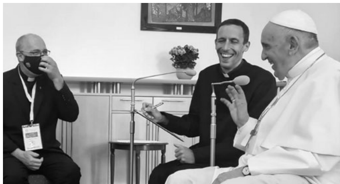
Papež povzbudil svou návštěvou i slovenské jezuitu

palo jako projev dvornosti, která spolu s ostatními ctnostmi statečnosti, věrnosti či velkorysosti tvořila součást rytířských ideálů.