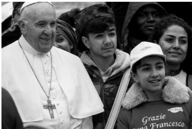
Papež vyzývá k budování ducha bratrství mezi různými kulturami

je založen na lásce, na tom, co papež ve své encyklice nazývá bratrství a sociální přátelství. Nakolik se od tohoto života vzdalujeme, natolik přizívujeme konflikty, nespravedlnost, podrobení mnohých chudobě a nucenou migraci.