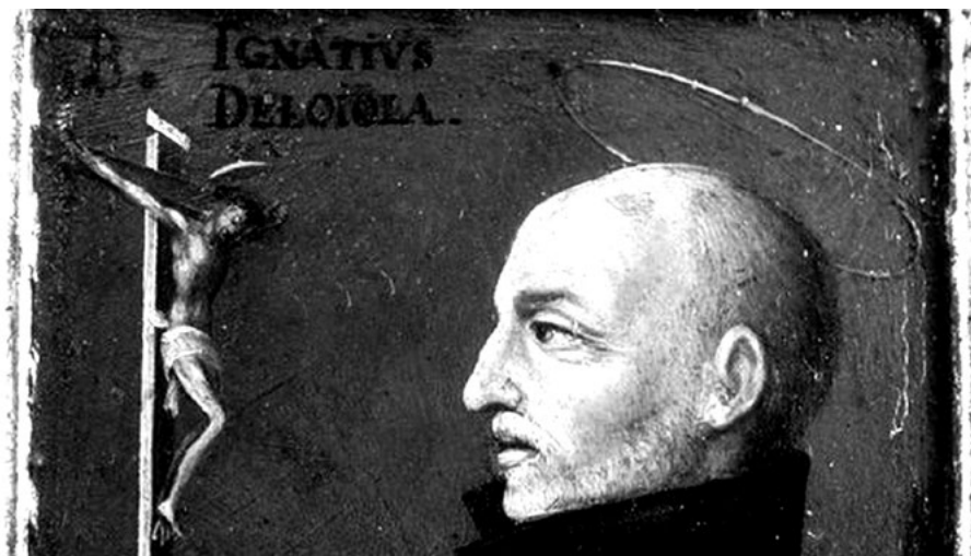
Svatý Ignác se rozhodoval s pohledem na kříž

V jezuitském řádu je to vedle slibu chudoby, čistoty a poslušnosti vyjádřeno čtvrtým slibem výhradní poslušnosti papeži v otázce poslání. Pečlivě jsou proto vybíráni ti, kteří by měli patřit do kruhu profesů čtyř slibů. Kandidáti by měli předtím prokázat dokonalou disponibilitu při přijímání dispozic od představených. Svátý Ignác sice v době sestavování Konstitucí nejvíce času strávil při formulaci způsobu, jak by jezuité měli prožívat chudobu, přesto nakonec jako typicky jezuitská ctnost vykrytalizovala poslušnost.