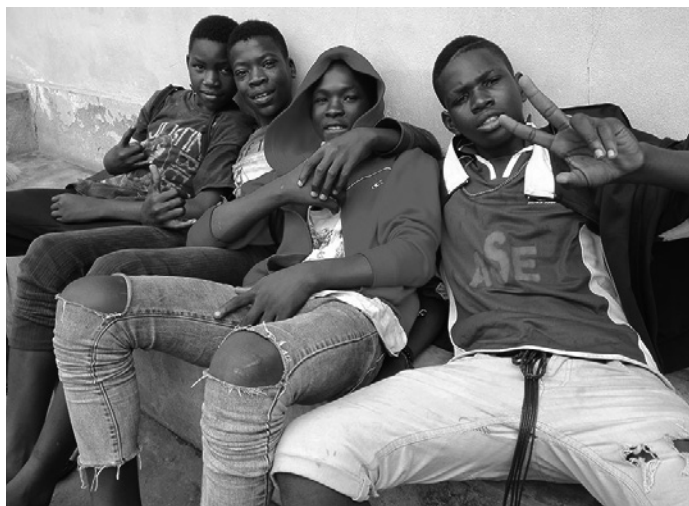
V chudých zemích se „děti ulice“ vyskytují v každém městě

ti, a pak vidět štěstí v jejich tvářích, když předvádějí představení před ostatními a sklízí nadšený potlesk. Dalším aspektem naší práce je setkávání s rodinami dětí.