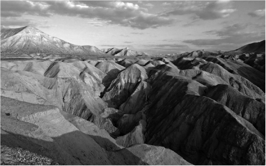
Otcové pouště byli přesvědčeni, že jejich úkol je vydobýt mír uvnitř, v srdci

Proto se za mír mezi národy modlili. Mír mezi nejbližšími sousedy se snažili zachovat vyvarováním toho, co jej nejvíc ruší, tj. slov. Proto zachovávali co nejvíce mlčení. Ale nakonec byli nejvíc přesvědčeni o tom, že jejich úkol je vydobýt mír uvnitř, v srdci. Nedosáhne se ho tím, že nebudeme mít znepokojující myšlenky, to není možné, ale že se je naučíme kontrolovat, že je nepřipustíme do srdce nikdy tak, že by nám je zakalily, že by začlonily světlo, které tak má stále svítit.