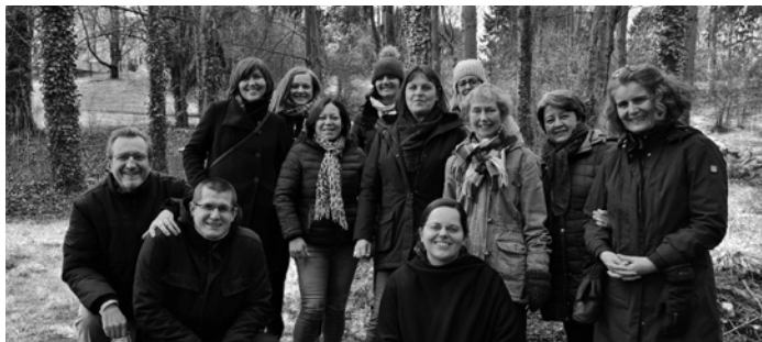
Autor článku druhý zleva

sokou úrovní začlenění a kulturní a náboženskou rozmanitostí, takže žáci mají možnost vybrat si předměty, které odpovídají jejich zvolenému náboženskému přesvědčení.