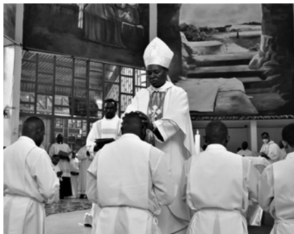
Africká církev a africké Tovaryšstvo – jáhenské svěcení v únoru 2023

Situace po II. světové válce vytvořila zcela nové misijní příležitosti. S poválečným rozpadem koloniálních říší se na misích v Africe začali podílet jezuité z Asie a Ameriky, což poněkud změnilo dosud výraznou