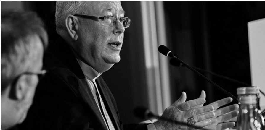
Kardinál J.-C. Hollerich SJ na setkání poslaneckého klubu evropských lidovců Evropského parlamentu ve Vídni v prosinci 2022

Církev se musí přizpůsobit. Poselství evangelia je stále aktuální, ale poslové se občas objevují ve staromódních kostýmech, čímž ovšem onomu poselství dělají medvědí službu... Proto se musíme přizpůsobit. Samozřejmě ne tím, že změníme poselství, ale že najdeme nový jazyk, aby bylo srozumitelné. Svět se stále dívá, ale už ne naším směrem, a to bolí. Musíme prezentovat poselství evangelia takovým způsobem, aby lidé znovu mohli pohledět na Krista.