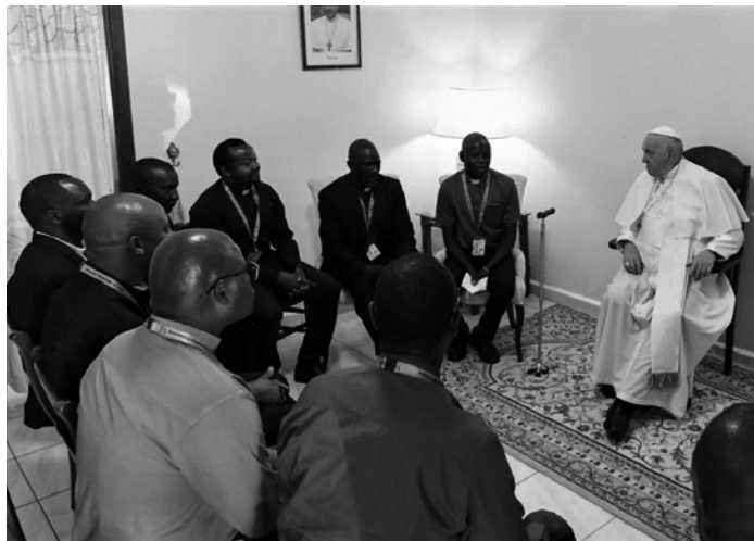
Papež František při setkání s jezuitou z Jižního Súdánu

víry. Proto nelze žít víru zde v Džubě způsobem, který je dobrý například pro Paříž. Je třeba hlásat evangelium každé konkrétní kultuře, která má svá omezení i své bohatství.“