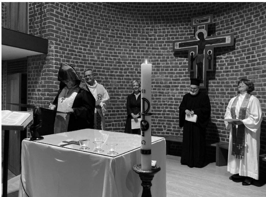
Ekumenická bohoslužba v bruselské Kapli pro Evropu na zahájení parlamentního roku 2022

zemích, jež tvoří evropský region v rámci JRS International. Instituce EU ji uznávají jako nevládní organizaci pomáhající uprchlíkům, která má přístup na diskuzní fóra o migrační politice. V současné době JRS-Europe koordinuje veškerou pomoc ukrajinským uprchlíkům v sousedních zemích.