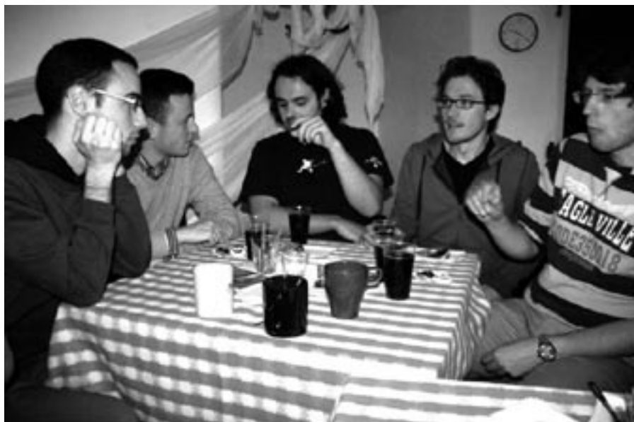
Studenti během Noci kostelů v Praze v květnu 2013

práci spolupracovníků, laiků či duchovních osob. „Důležitá je také větší koordinace mezi studentskými kaplany. Jsou to silné osobnosti, které často nevidí nějaký prospěch a obohacení ve vzájemném setkávání. Jsme uzavřeni sami v sobě a zaměřujeme se na řešení svých problémů, na spolupráci nezbyvá nikomu energie. Možná by mělo vzniknout nějaké centrum koordinace, které by se zabývalo i evropskými otázkami,“ uvádí český provinciál.