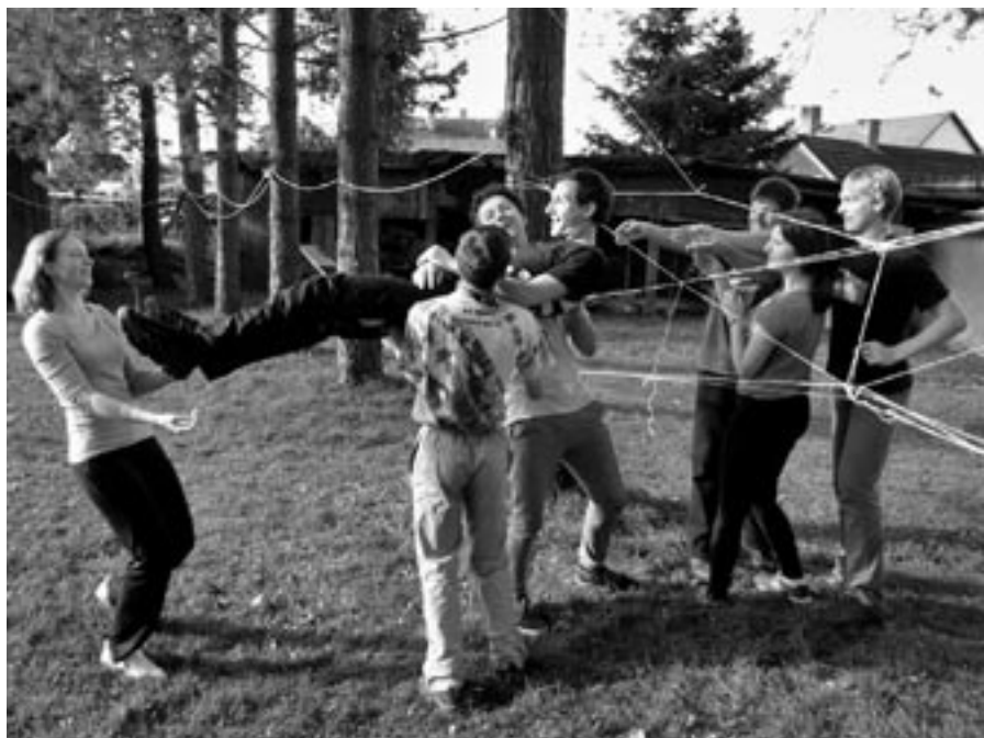
Týmová spolupráce ve VKH Brno začíná již na Vikendu nejen pro priváky