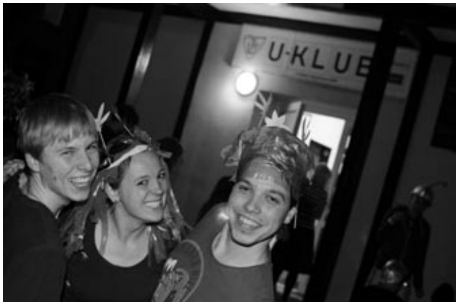
Církevního silvestra olomoučtí vysokoškoláci pravidelně slaví v U-klubu zvaném „Účko“

„VKH Praha funguje v současné podobě přes dva roky, i když má mnohem delší historii. Hodně akcí jsme